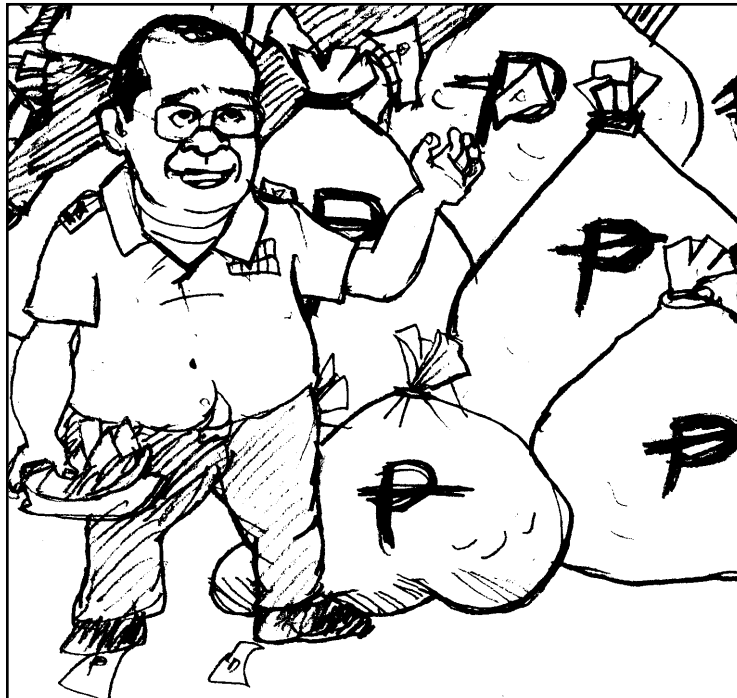
Nagakadasma ang mga upisyal sang AFP kag pati ang rehimen agud pungan ang dugang nga pagbuyagyag sang mga anomalya kag mga kaso sang korapsyon kag pagpanguripon sa armadong kusog...

ment of Defense. Madumduman ginpauntat ang mga kaso sang pagpanguripon batuk sa iya sadtong nagligad nga tuig makaligad siya magbiya sa pusisyon. Suno sa iya statement of liabilities pa lang, nagdaku sang ₱4.1 milyon ang iya manggad halin 2002 tubtub 2003. Sa panahon man nga ini, nakapatindog siya sang balay nga nagabalor sang ₱10 milyon kag nakabakal siya sang duha ka restawran sa Bulacan kag Cebu City.