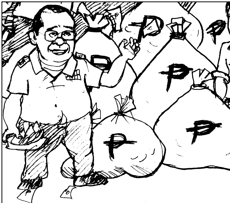
Nagkakandarapa ang mga upisyal ng AFP at maging ang rehimen upang pigilin ang ibayong pagkakabunyag ng mga anomalya at mga kaso ng korapsyon at pandarambong sa sandatahang lakas...