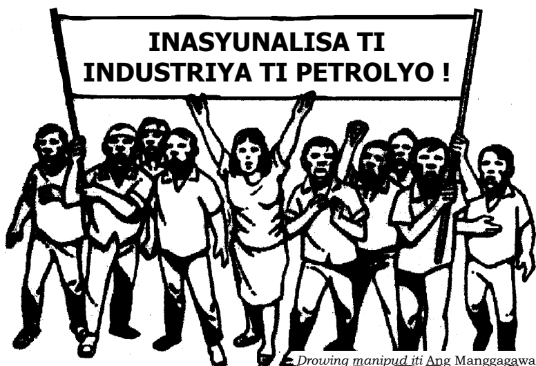
E. Drowing manipud iti Ang Manggagawa

Ti nasyunalisasyon ti industriya ti petrolyo, ngarud, ket saan a mabalin nga isina iti pannakidangadang para iti rebolusyonaryo a panagbalbaliw ti gimong. Ti pananggibus iti imperyalista a kontrol iti industriya ti petrolyo ket paset laeng ti pananggibus iti imperyalista a kontrol iti gimong a Pilipino iti kabuklan.