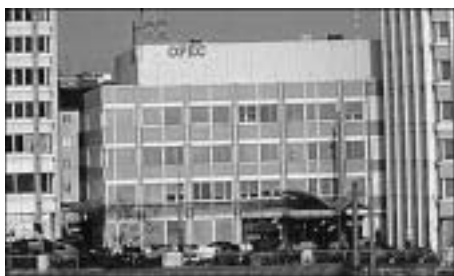
Hedkwarter ti OPEC iti Vienna, Austria

Emirates, Kuwait, Indonesia, Libya, Algeria ken Qatar. Nabukel daytoy idi 1960 iti panggep nga ikoordinada dagiti patakaran iti produksyon ti petrolyo dagiti miembro a pagilian iti sango ti sobra a produksyon nga ar-aramiden