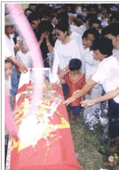
... pagtumod sa patayng lawas ni Ka. Tamtam didto sa lubnganan sa Salay.