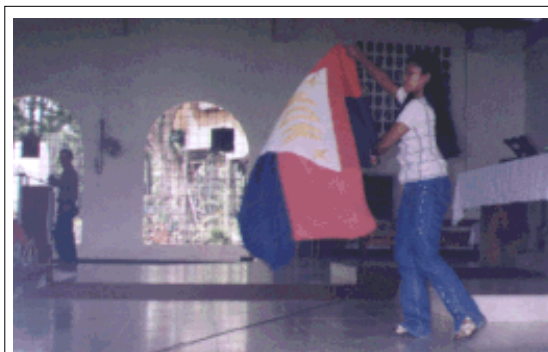
... gipakayab sulod sa simbahan ang bandila sa NDF.

Kami naghangyo sa katawhang nagpakabana ug mahigugmaon sa kagawasan ug kaangayan sa pagbisita sa iyang patay'ng lawas ug pagkuyog panahon sa iyang lubong.