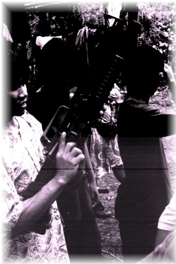
Dagiti kadre militar: sisasagana nga agisuro kadagiti baro a kakaddua

sumarsaruno nga agbalin a kadre pulitiko-militar ken kumander ti NPA.