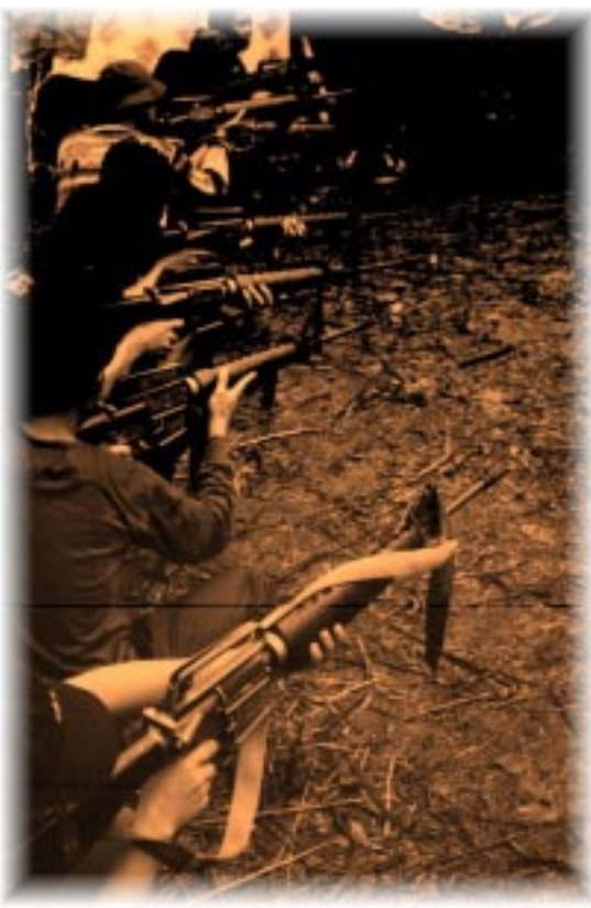
Naregta a panagsanay manen dagiti baro a mannakigubat

5 a trak a mapatta-patta a 2 a platon) laban iti bassit laeng a pwersa ti NPA.