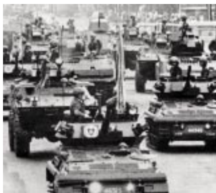
Umili ti mapanggeddeng, saan a dagiti banag kas ti ramit militar

Naituyang ti P331 bilion a kuarta ti umili nga agserbi iti panangpadur-as ti AFP. Malaksid ditoy, sansanayen pay daytoy (AFP) ti imperialismo nga US tapno lalo a mapakaro ti panangranggas. Biagen manen dagiti grupo a vigilante. Padakkelen pay ti CAFGU. Nakatakderen daytoy iti nasurok innem a ribo a bario iti intero a Pilipinas. Iti Tanap ti Cagayan, adda uppat a kompania ti CAFGU ita a naiwaras.