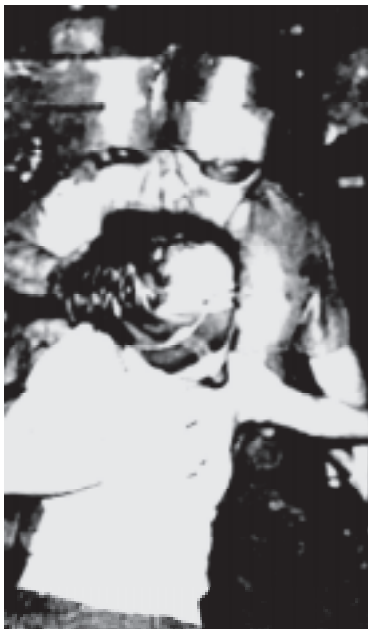
Panagranggas kadagiti mobilisasion a masa iti ciudad

Daytoy ti paulit-ulit a napaneknekan ti rebolusionario a tignayan iti sango ti adun a kontra-insurhensia a programa ti agari-ari a dasig. Saan a mapengdan ti pangngeddeng ti umili nga agrebolusion tapno gun-odenda ti nailian a wayawayaya ken demokrasiya. B