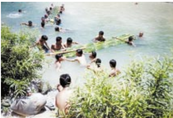
Panagsanay ti NPA iti river-crossing: panagkaykaysa ken koordinasyon

Idiay ko a narikna a naawatanen ni Nanang ti taktakderak. Inspirasyon iti panagsublik kadagiti kadinnanggay ko a kakaddua. B