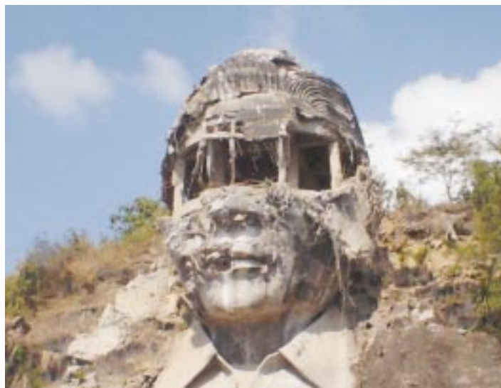
MONUMENTO TI ABSOLUTO A KINAAROGANTE KEN KINALASTOG

Maysa a simboliko nga addang tapno ipalagip ti pannakapaay ken pagbaybay-a ti nagsasaruno a rehimen manipud Rehimen ni Aquino agingga ita iti panagsingir iti pamilya Marcos ken dagiti kroni na iti nakaro a didigra nga impaay da iti umili idi panawen ti diktadura