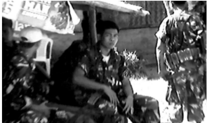
TROPA TI 41 IB PA: BERDUGO ITI DAYA A CAGAYAN

Pampaneknekan ti napasamak a panagtagbat kadagiti mannalon ti Caruppian ken adu pay a krimen da iti Baggao ti kinaranggas ken kinaterorista ti AFP