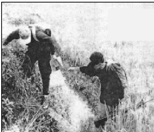
Dagiti Nalabaga a Gerilia, representante ti Red Cross ken POW