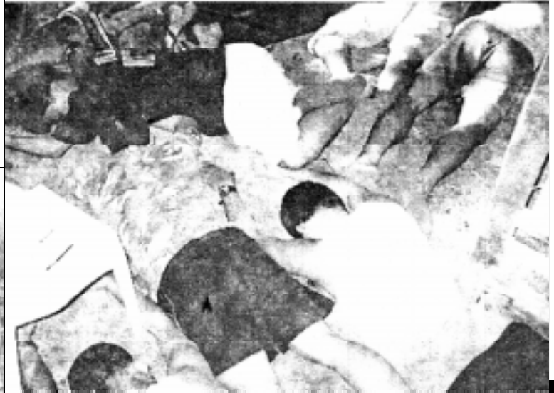
Ti hedkwarter a na-reyd (kannigid) ken dagiti nadis-armaan a tropa ti PNP

M AYSAS A BABY M60 machine gun, maysa a 60-mm mortar ken 52 a bala ti mortar, 55 nga M16 ken M14 ken 12,000 a bala, tallo nga M203 ken nasurok 50 a bala, maysa a shotgun, 18 a kalibre .45 ken .9mm a pistol, lima a rebolber ken nasurok 20 a granada.