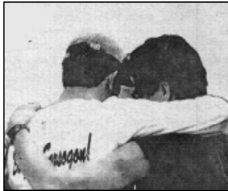
Ni Bernal (akinkannigid, nakapuraw) ken dagiti gerilia ti NPA a nangbantay kenkuana

Naminsan pay a napaneknekan ti nainkalinteg a galad ti rebolusionario a gubat ti umili