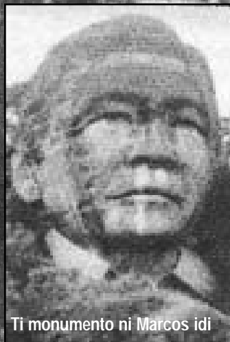
Ti monumento ni Marcos idi