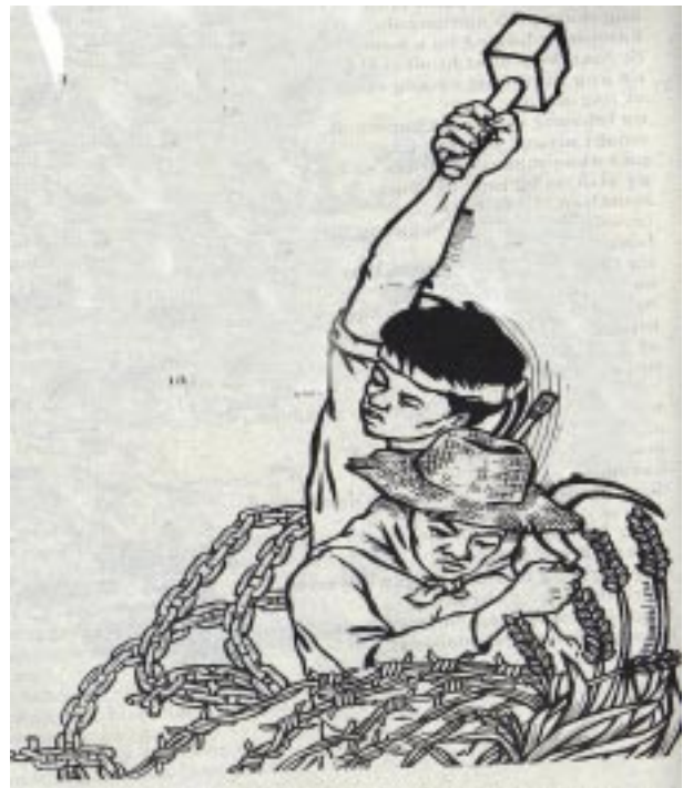
Grapik mula sa ULOS

Sa paglutas ng kanilang suliranin sa lupa, nalalantad ang kahungkagan ng reporma sa lupa ng papet na gubyernong Estrada at ibayong tumitibay ang kapasyahan at sariling lakas ng masang magsasaka sa pagsusulong ng rebolusyong agraryo sa balangkas ng bagong demokratikong rebolusyon.●