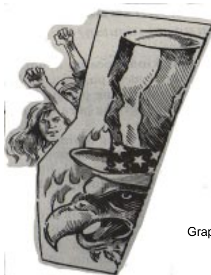
Grapik mula sa Ulos

Ibayong lumalakas ang kahilingan ng mamamayan para sa pambansang pagpapalaya. Ipinapakita ito ng masigabong pagtutol sa VFA, sa mga patakaran sa ekonomyang sakmal ng dayuhang monopolyo, at higit sa lahat, sa pagsulong ng armadong rebolusyon para pabagsakin ang panlipunang sistemang pinaghaharian ng imperyalismo, burukrata kapitalismo at pyudalismo. Lumalawak ang bilang ng mamamayang namumulat na ang demokratikong rebolusyong bayan sa pamamagitan ng matagalang digmang bayan ang puspusang papawi sa malakolonyal na kaayusan ng lipunang Pilipino.●