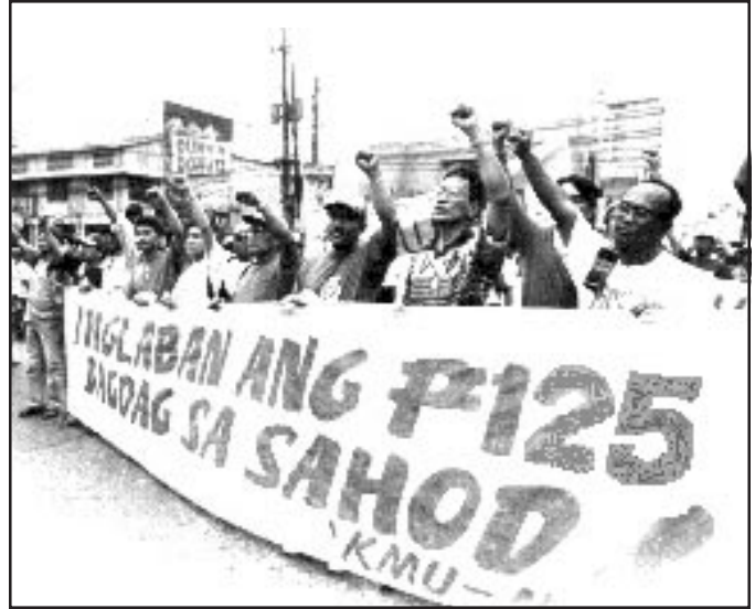
Nakikibakang mga manggagawa para sa dagdag na sahod.

Nauna pa rito ang pagtatangka ni Estrada na ipagbawal