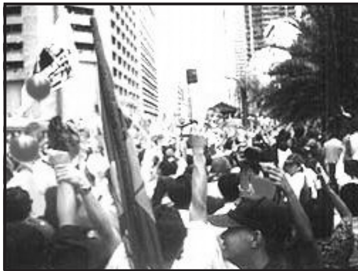
Malaganap ang pagtutol ng mamamayan sa VFA.

botohan sa Senado, aminado sila na maraming kakulangan at disbentahe ang VFA para sa bansa. Subalit, likas na taksil sa taumbayan, sinang-ayunan pa rin nila ang VFA dahil ito ang utos ng kanilang imperyalistang amo. Bukod sa kailangan nilang magbayad ng pampulitikang utang kay Estrada. ( Tingnan sa Talaan 1 ang listahan ng mga senador na sumang-ayon sa VFA, pahina 16. )