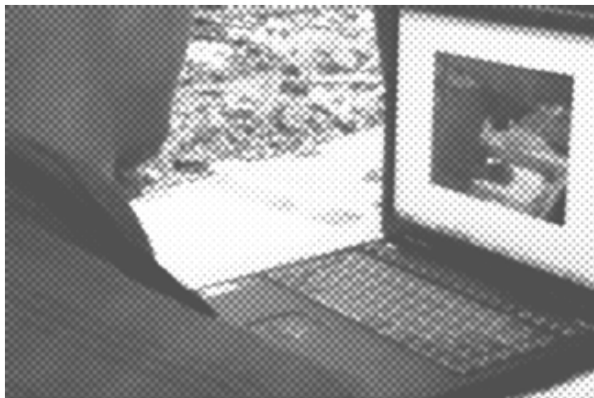
Isang kasamang nag-aaral mag-edit ng isang produksyong bidyu.

N itong Hulyo at Setyembre, idinaos sa rehiyon ang dalawang pagsasanay sa paglikha ng mga "pelikulang bayan" o mga rebolusyonaryo at progresibong produksyong bidyu.