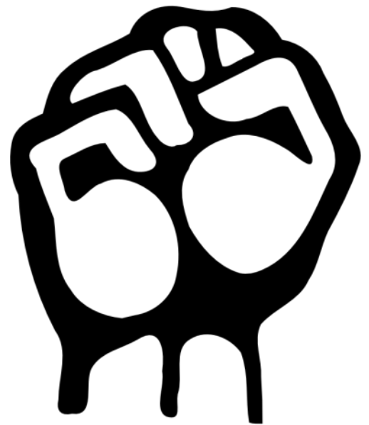
GUBAT TI UMILI, IPAGBALLIGI! AGRIMBAW, AGADAL KEN AGPURSIGE! AGBIAG TI NAILIAN DEMOKRATIKO A REBOLUSYON TI UMILI!

Papigsaen ti kolektibo a panangidaulo ti Partido. Isabiag dagiti basaran a prinsipyo. Pairutan ti silpo iti masa ken nainsigudan a takder, pannirigan iti rebolusyon - palawaen ti rebolusyonaryo a bileg ken impluwensiya - RIINGEN, ORGANISAEN ken PATIGNAYEN ti kalawaan a basaran a masa ken amin a demokratiko a dasig ken sektor.