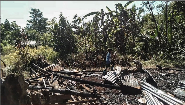
Naugdaw nga mga balay sa mga residente sa Canada.