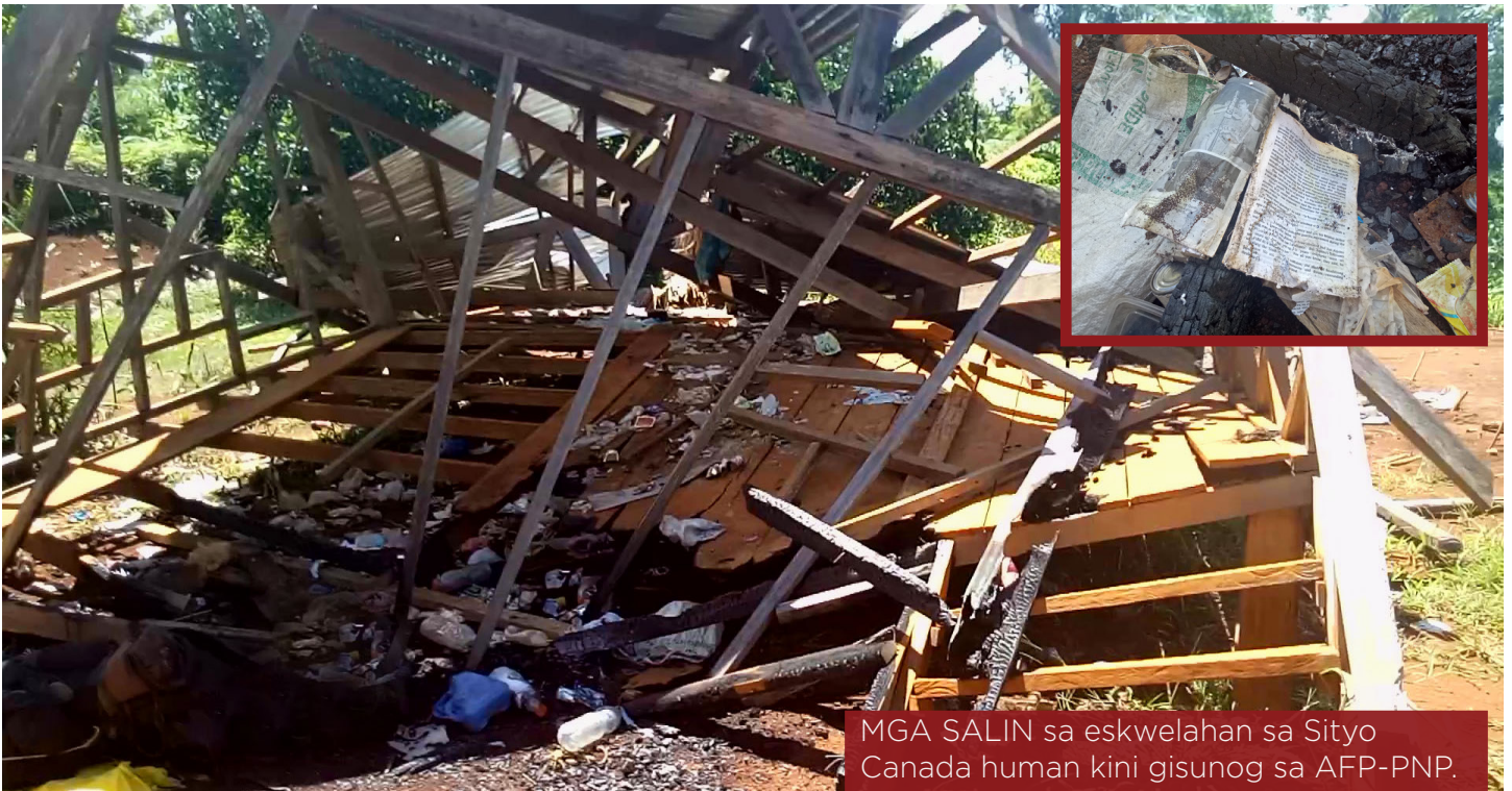
MGA SALIN sa eskwelahan sa Sityo Canada human kini gisunog sa AFP-PNP.