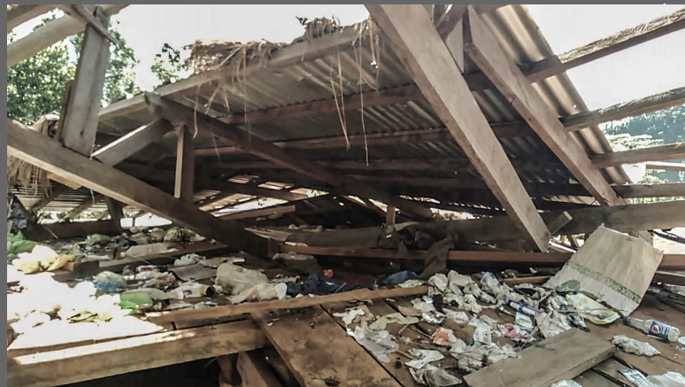
Uniporme sa pulis nga nabilin sa gisunog nga eskwelahan