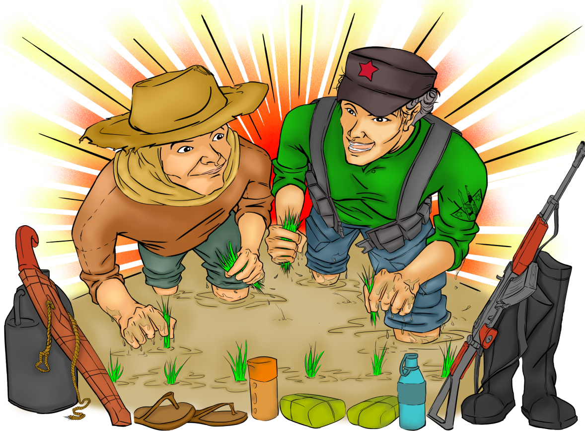
“Kalihukan...,” gikan sa palid 9

usab ang mga estudyante sa usa ka kolehiyo aron makapakaylap og impormasyon kabahin sa Covid-19. Lakip sa maong inisyatiba ang pag-endorso sa mga gustong magpatambal ngadto sa mga kaila nga doktor o nars sa maong mga estudyante.