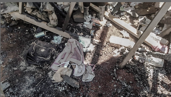
Gipangsunog ug gipangguba nga mga gamit sa eskwelahan