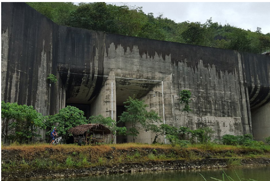
Ang mapaminsalang Kaliwa Dam sa Quezon

Kasama ng mga katutubo’t magsasaka sa kanilang pagtutol