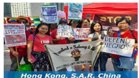
Hong Kong, S.A.R. China