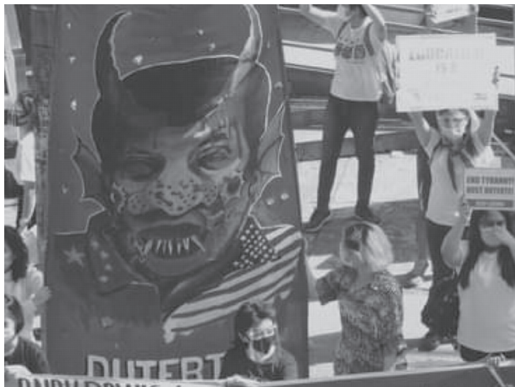
Protesta ng mga kabataan bitbit ang dibuhong naglalahad kay Duterte bilang tuta ng US at China sa Laguna.

Ayon sa Anakbayan-TK, "Balikan natin ang makasaysayang paglago ng pakikibaka ng mga kabataan sa Timog Katagalugan kasabay ng pagtanaw sa tagumpay