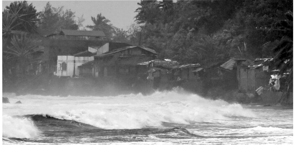
Mararahas na alon sa tabing-dagat ng Quezon.

Kapalit ng mga “benepisyo” ng dam ang panganib sa buhay ng mamamayan. Ang pagpapakawala sa malaking bolyum ng tubig sa mga dam ay nagdudulot ng malawakang