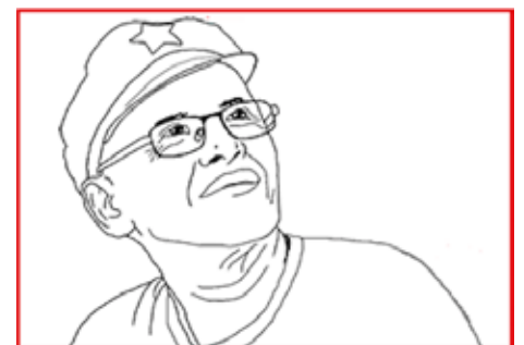
MGA KWENTO NI KA MADAAY

Ganun pa man, sa pagsabak sa gawain sa mga erya, hindi na lamang Covid-19 ang kinaharap ng mga kasama kundi pati na ang walang tigil na FMO/RCSPo ng 203rd Brigade-PA at PNP-MIMAROPA. Lubusang binalewala ang panawagan ng UN at bagkus ay pinaigting ang kontra-insurhensyang programa nito imbes na pagtuunan ang paglaban sa pandemya. Kaya nalantad ang kawalang