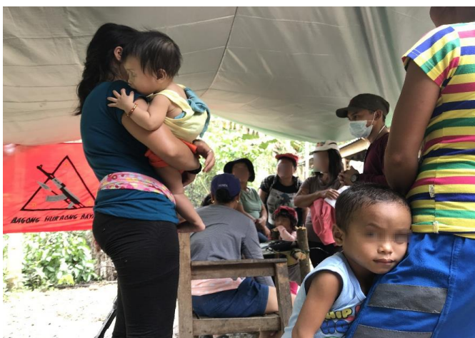
Medik nga nagasugilanon sa pumuluyo sa Klinikang Bayan sang NPA.

“Virulent disease”, “comorbidity”, “asymptomatic”, “inoculation”, “bubble lockdown”, “reverse transcription polymerase chain reaction, eqc” - ini ang mga tinaga nga nangin komun sa pamatian sang pumuluyo sa malapit duha na ka tuig. Kon tun-an ang mga abiso, poster kag pahayag sang gobyerno angot sa pandemya humalin Enero 2020 asta sa subong, makit-an nga indi lapnagon ang paggamit sang Pilipino bilang mayor nga lenggwahe sa komunikasyon. Makit-an ini sa mga dokumento sang Department of Health kag Inter-Agency Task Force for the Management of Emerging Infectious