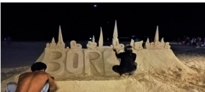
Mga sand artist sa Boracay nga nadulaan sang palangabuhian sa panahon sang closure sadtong 2018.

A kig ang pumuluyong Aklanon sa pagduso sang gobyerno ni Duterte nga magtukod sang korporasyon nga magakontrol sa mga aktibidad sa isla sang Boracay. Sadtong Agosto 4, ginpasar sa ikaduha nga deliberasyon sa Kongreso