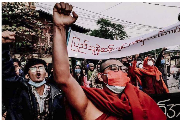
Kilos-protesta ng mamamayan ng Myanmar sa Mandalay noong Pebrero 1, 2022.

Mula nang ilunsad ang kudeta at pinanumbalik ang huntang militar sa bansa, nagpatuloy ang mga kaguluhan sa Myanmar. Kabi-kabila ang mga protesta sa kalsada na malupit at marahas namang sinusupil ng pamumunong militar ng hunta. Ayon sa mga ulat, tinatayang aabot na sa 12,000 ang bilang ng mga