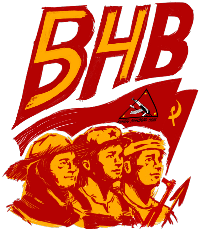
Ika-54 Anibersaryo ng Bagong Hukbong Bayan

Kumikilos at lumalaban ang uring proletaryado't masang anakpawis at iba pang demokratiko't aping uri sa daigdig laban sa grabeng kahirapan, pagsasamantala, pang-aapi, gera't pagkawasak ng kapaligiran dulot ng imperyalismo, at sa burgesyang paghahari at ng mga kasabwat nilang lokal na mapagsamantalang uri sa iba't ibang mga bayan. Itinutulak ng krisis na ito ang pagkumulat ng maraming sambayanan at ng sangkatauhan para sa pangangailangan ng armadong rebolusyon upang ibagsak ang imperyalismo at para sa pambansang pagpapalaya at sosyalismo bilang tanging lunas sa krisis. Tiyak ang Partido at BHB sa maaliwalas na rebolusyonaryong bukas para sa sambayanan at sangkatauhan.