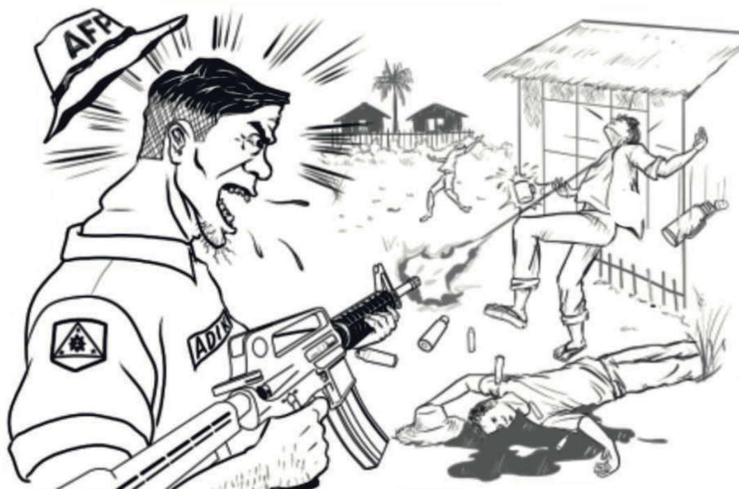
"62nd IB..." sundan sa pahina 6