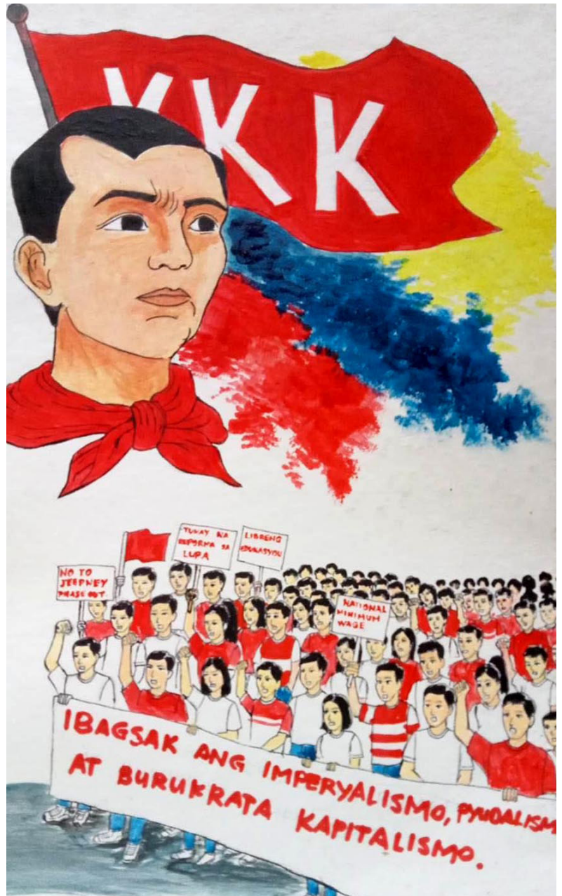
Paano nagiging inspirasyon si Bonifacio sa mga manggagawa