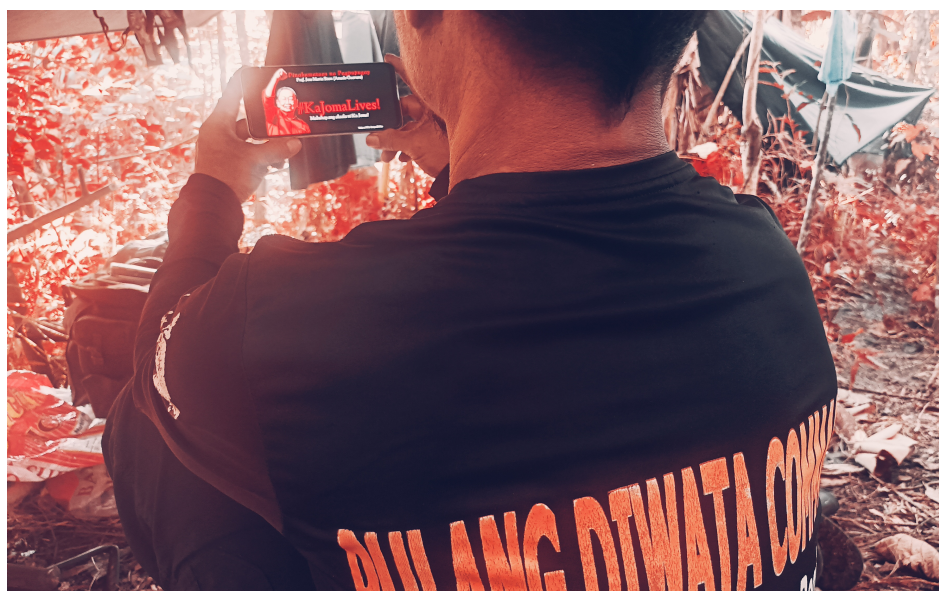
Usa ka Pulang manggugubat sa Northeast Mindanao nakabalita sa pagpanaw ni Ka Joma

Nabutyag ang mga limitasyon sa gahum sa imperyalismong sa US sa kapakyasan niining ilugon ang mga rekurso sa lana ug magtukod og 16 ka base militar sa Iraq, pagguba sa alyansa sa Syria-Russia-Iran, pagbungkag sa rebolusyonaryong pakigbisog sa katawhang Turko ug Kurdish ug pagkupot ngadto sa Afghanistan nga gisurender niini ngadto sa Taliban. Sa kasamtangang panagbangi tali sa Russia ug Ukraine, gigamit sa US ang Ukraine isip proxy aron hulgaon ug hagiton ang Russia nga maglunsad og gubat, apan ang panagbangi misangpot lamang sa pag-usik-usik sa rekurso sa imperyalismong Russia ug US. Kini ang hinungdan nga bisan ang mga kaalyado sa NATO sa US nagreklamo kung nganong kinahanglan silang mogasto og daghang salapi alang