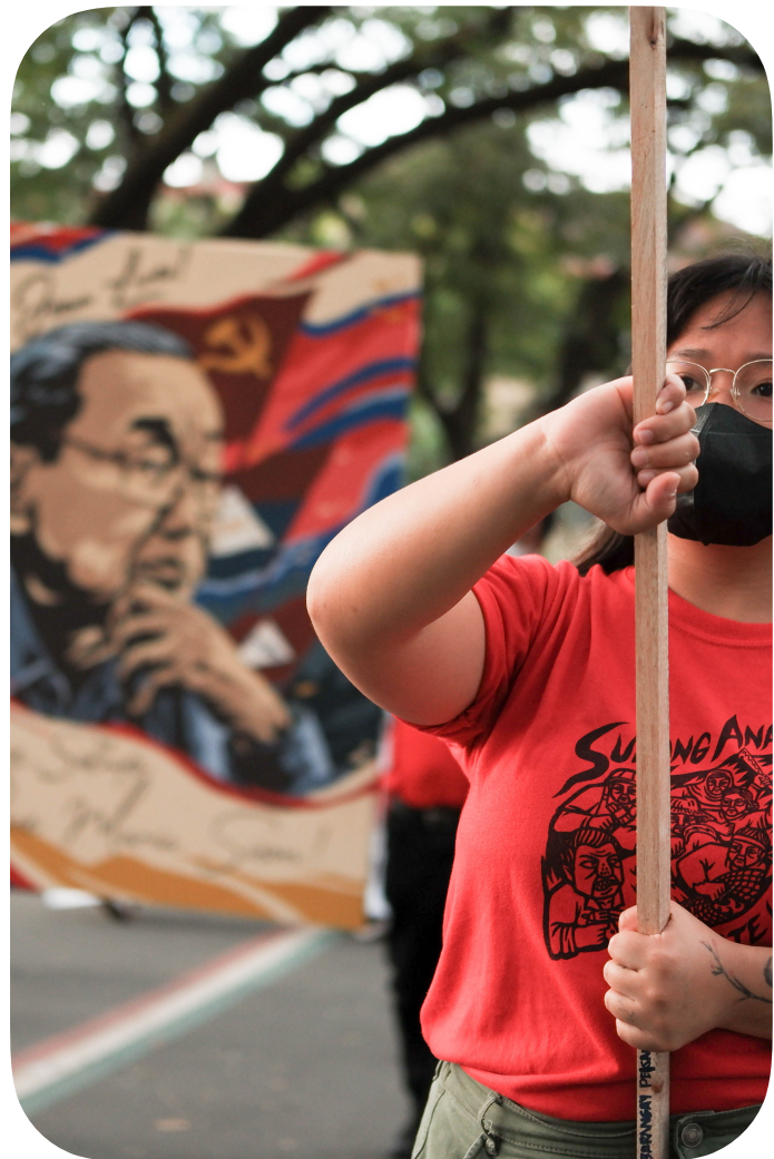
Nagmartsa ang mga organisasyon sa katawhan sulod sa UP-Diliman isip parangal niadtong Disyembre 19, 2022

Kung kapuyon ug miatras ang nagkampo nga kaaway, higayon kini sa BHB nga moabante ug maglunsad og mas daghang opensibang bira. Apan samtang daw mas labaw ang kaaway sa pag-abante ug pagkampo, ang pwersa sa BHB sa taktikal nga pag-atras sa usa ka natarang gerilya makahimo og mga taktikal nga opensiba nga mapadaog niini sa mga duol nga lugar. Labaw dili maayo para sa kaaway, sama sa kasagarang