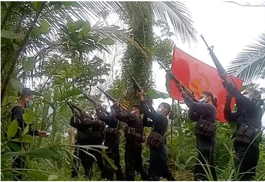
Ang mga manggugubat sa BHB gikan sa Central Luzon nag-21-gun salute para kang Ka Joma

konstitusyon batok sa mga langyawng base militar ug pwersa sa Pilipinas pinaagi sa Enhanced Defense Cooperation Agreement aron tugutan ang mga pwersang militar sa US nga magbaton og eksklusibong base ug pasilidad sulod sa mga kampo ug reserbang militar sa mga reaksyunaryong armadong pwersa. Apan karon, dayag ang pakiglantugi sa US sa China sa pagpangawkaw sa natural nga rekurso sa Pilipinas ug sa tibuok ASEAN.