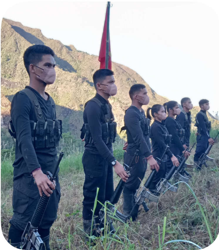
Mga manggugubat sa BHB gikan sa North Central Mindanao nakapormasyon aron mag-21-gun salute para kang Ka Joma

Imposibleng mapugngan sa reaksyunaryong estado ang pipila ka kadre sa PKP sa pagtuman gimbuhatong pang-ideolohiya. Sa paglabay sa mga tuig ug dekada, ubos sa pagdumala sa Revolutionary School of Mao Zedong Thought (Rebolusyonaryong Eskwelahan sa Panghunahunang Mao Zedong), nakahatag silag edukasyon sa mas daghang kadre ug