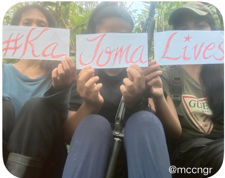
Mga Pulang manggugubat sa Negros nagsauglag sa kinabuhi ni Ka Joma, Disyembre 19, 2022

Sa pagkatinuod, upisyal nga giangkong sa reaksyunaryong armadong pwersa nga mikusog ang