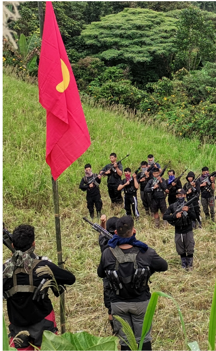
Pagparangal sa mga Pulang manggugubat kang Ka Joma Disyembre 19, 2022

Sa matag mayor nga pagpaling sa ekonomikanhong palisiya niini sa East Asia, kanunayng gisiguro sa imperyalismong US nga pugngan ang ekonomikanhong paglambo pinaagi sa programa sa tinuod nga reporma sa yuta ug nasudnong