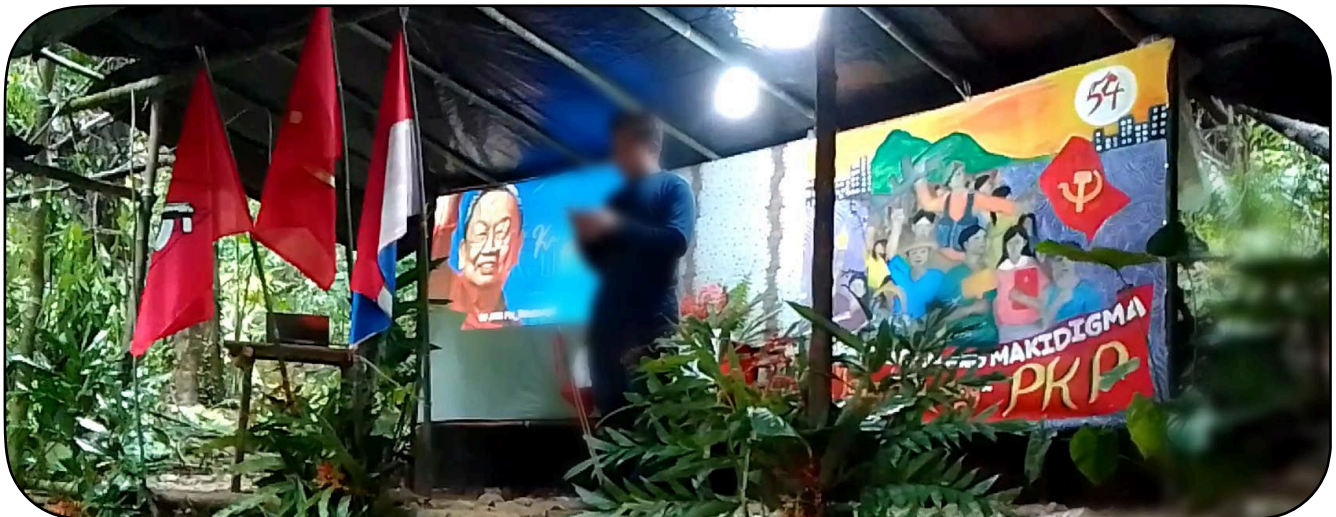
Programa sa mga kauban sa Blcol alang kay Ka Joma

Ang pagbase ni Ka Joma sa Utrecht nahimong sentro sa pulitika sa internasyunal nga komunista ug anti-imperyalistang pagsukol ug kalihukan. Iyang gipatuman ang importanteng papel sa selebrasyon sa sentenaryo ni Mao Zedong niadtong 1993 nga nagsilbing lagsik nga kampanya sa ideolohiya aron subling palig-onon ang Marxista-Leninistang mga panglantaw ug isangyaw ang Maoismo isip ikatulong makasaysayanong paglambo sa Marxismo-Leninismo.