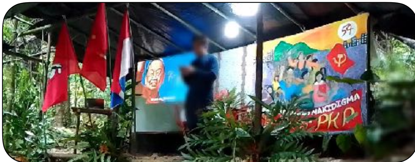
Programang mga kauban sa Bicol alang kay Ka Joma

Ang pagbase ni Ka Joma sa Utrecht nahimong sentro sa pulitika sa internasyunal nga komunista ug anti-imperyalistang pagsukol ug kalihukan. Iyang gipatuman ang importanteng papel sa selebrasyon sa sentenaryo ni Mao Zedong niadtong 1993 nga nagsilbing lagsik nga kampanya sa ideolohiya aron subling palig-onon ang Marxista-Leninistang mga panglantaw ug isangyaw ang Maoismo isip ikatulong makasaysayanong paglambo sa Marxismo-Leninismo.