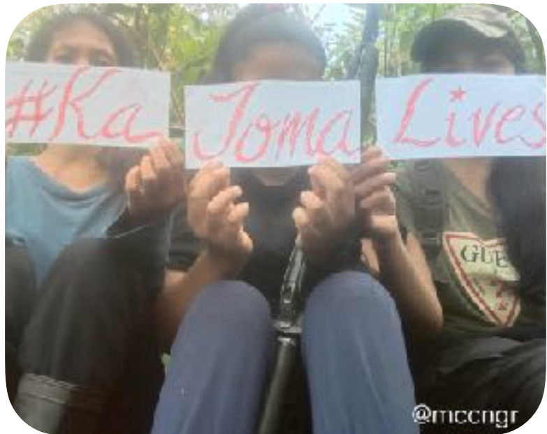
Mga Pulang manggugubat sa Negros nagsauglag sa kinabuhi ni Ka Joma, Disyembre 19, 2022

Sa pagkatinuod, upisyal nga giangkong sa reaksyunaryong armadong pwersa nga mikusog ang