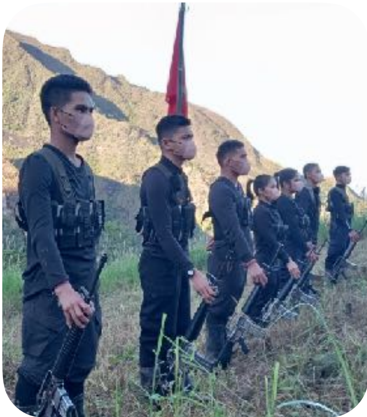
Mga manggugubat sa BHB gikan sa North Central Mindanao nakapormasyon aron mag-21-gun salute para kang Ka Joma

Imposibleng mapugngan sa reaksyunaryong estado ang pipila ka kadre sa PKP sa pagtuman gimbuhatong pang-ideolohiya. Sa paglabay sa mga tuig ug dekada, ubos sa pagdumala sa Revolutionary School of Mao Zedong Thought (Rebolusyonaryong Eskwelahan sa Panghunahunang Mao Zedong), nakahatag silag edukasyon sa mas daghang kadre ug