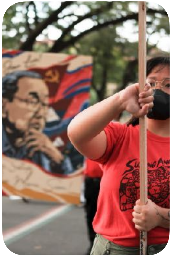
Nagmarisa ang mga organisasyon sa katawhan sulod sa UP-Diliman isip parangal niadtong Disyembre 19, 2022

Kung kapuyon ug miatras ang nagkampo nga kaaway, higayon kini sa BHB nga moabante ug maglunsad og mas daghang opensibang bira. Apan samtang daw mas labaw ang kaaway sa pag-abante ug pagkampo, ang pwersa sa BHB sa taktikal nga pag-atras sa usa ka natarang gerilya makahimo og mga taktikal nga opensiba nga mapadaog niini sa mga duol nga lugar. Labaw dili maayo para sa kaaway, sama sa kasagarang