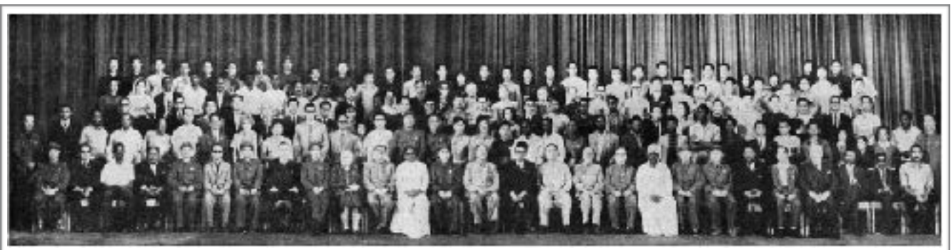
Ka Joma ug Ka Julie (ikatulo nga laray luyo ni Chairman Mao ug Premier Zhou Enlai) nga mitambong sa ika-25 nga anibersaryo sa Yanan Forum sa China nga gipamantal sa People's Daily niadtong Mayo 8, 1967

Gipangulohan niya ang Partido sa sayong yugto sa pagtubo niini. Gisulat niya ang Organizational Guide and Outline of Reports (Giya sa Organisasyon ug Gambalay sa mga Taho) niadtong Abril 1971 ug ang Revolutionary Guide to Land Reform