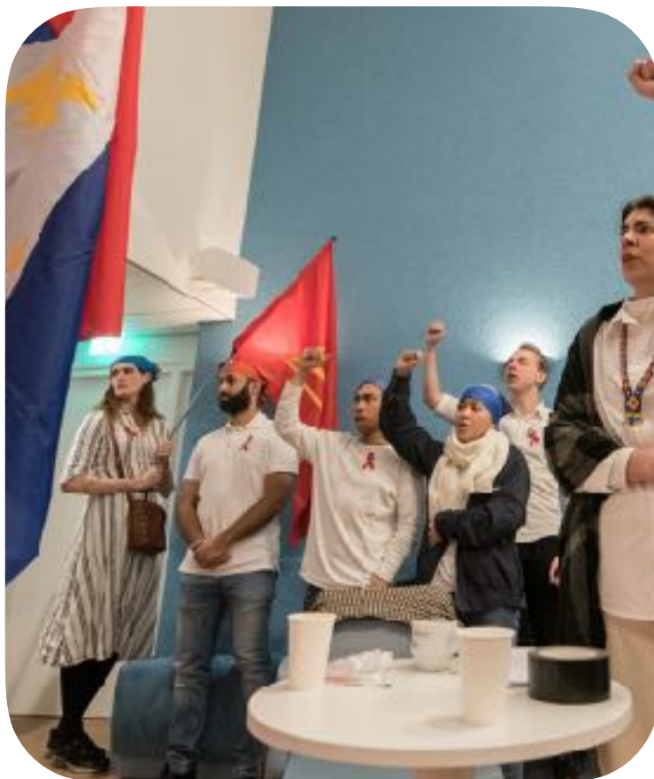
Pagpasidungog sa internasyunal nga mga higala sa Utrecht, Disyembre 23, 2022 kay Ka Joma

Kalibutan. Apan sa kasamtangan, anaa pay UN ug multilateral ug bilateral nga relasyon sa mga estado tali pareho sa mga nag-unang imperyalistang nanagbangi ug mga ikatulong kalibutan nga nanalipud sa ilang kaugalingong nasudnong soberanya