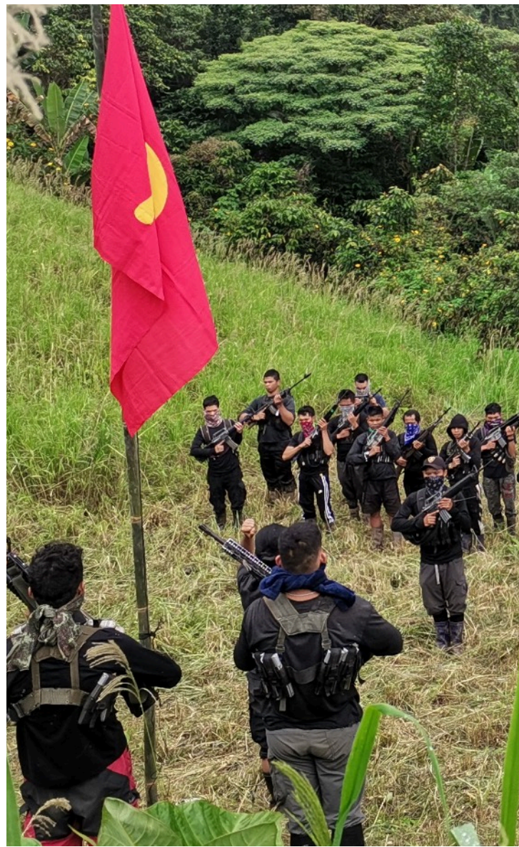
Pagparangal sa mga Pulang manggugubat kang Ka Joma Disyembre 19, 2022

Sa matag mayor nga pagpaling sa ekonomikanhong palisiya niini sa East Asia, kanunayng gisiguro sa imperyalismong US nga pugngan ang ekonomikanhong paglambo pinaagi sa programa sa tinuod nga reporma sa yuta ug nasudnong