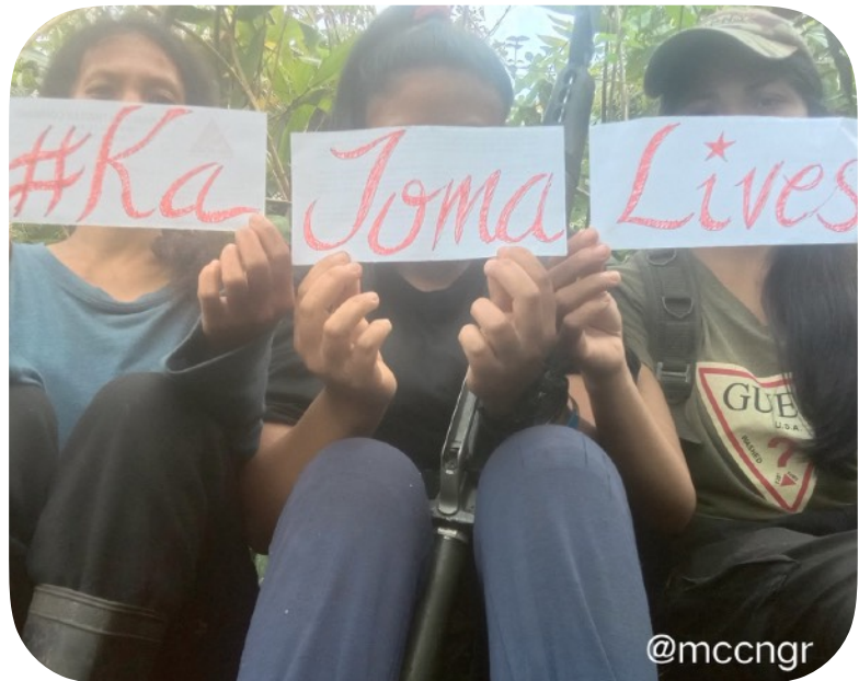
Mga Pulang manggugubat sa Negros nagsauglag sa kinabuhi ni Ka Joma, Disyembre 19, 2022

Sa pagkatinuod, upisyal nga giangkong sa reaksyunaryong armadong pwersa nga mikusog ang