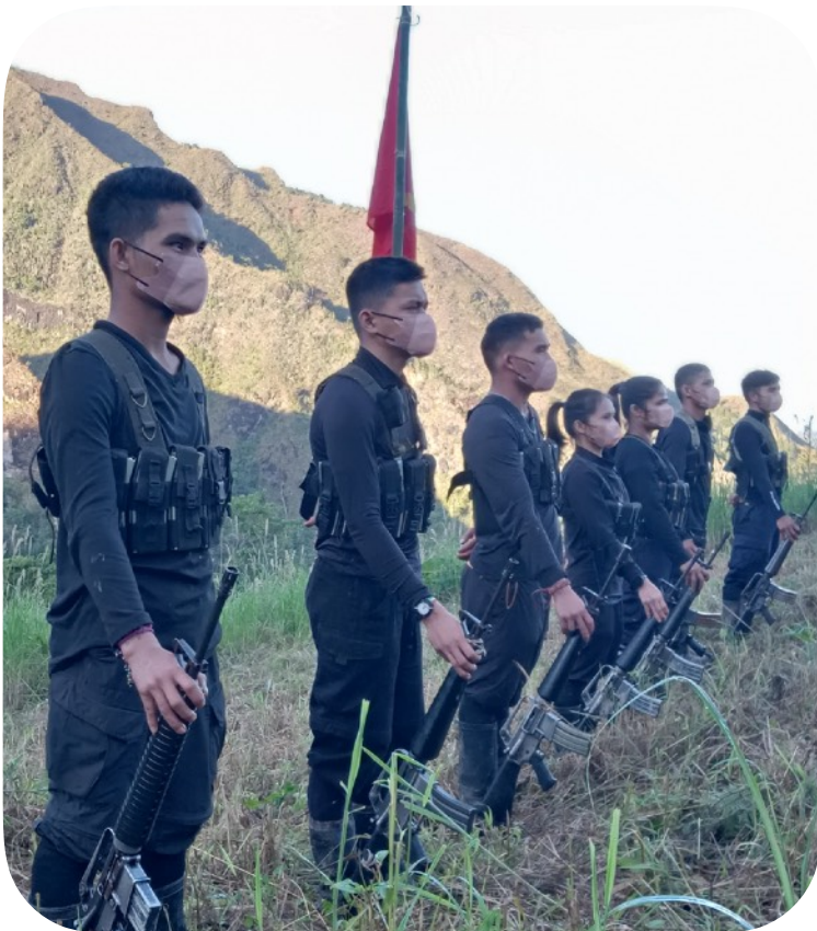
Mga manggugubat sa BHB gikan sa North Central Mindanao nakapormasyon aron mag-21-gun salute para kang Ka Joma

Imposibleng mapugngan sa reaksyunaryong estado ang pipila ka kadre sa PKP sa pagtuman gimbuhatong pang-ideolohiya. Sa paglabay sa mga tuig ug dekada, ubos sa pagdumala sa Revolutionary School of Mao Zedong Thought (Rebolusyonaryong Eskwelahan sa Panghunahunang Mao Zedong), nakahatag silag edukasyon sa mas daghang kadre ug