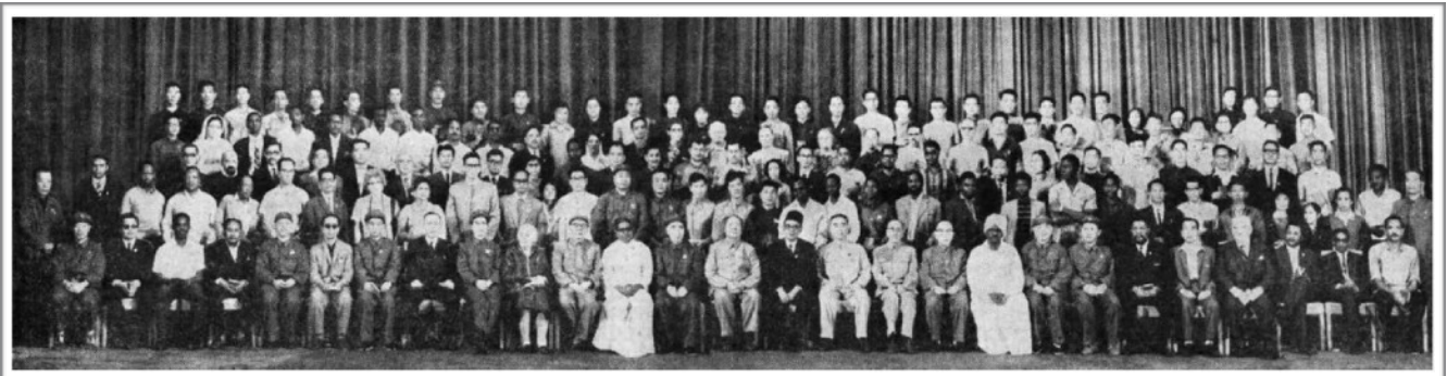
Ka Joma ug Ka Julie (ikatulo nga laray luyo ni Chairman Mao ug Premier Zhou Enlai) nga mitambong sa ika-25 nga anibersaryo sa Yanan Forum sa China nga gipamantal sa People's Daily niadtong Mayo 8, 1967

Gipangulohan niya ang Partido sa sayong yugto sa pagtubo niini. Gisulat niya ang Organizational Guide and Outline of Reports (Giya sa Organisasyon ug Gambalay sa mga Taho) niadtong Abril 1971 ug ang Revolutionary Guide to Land Reform