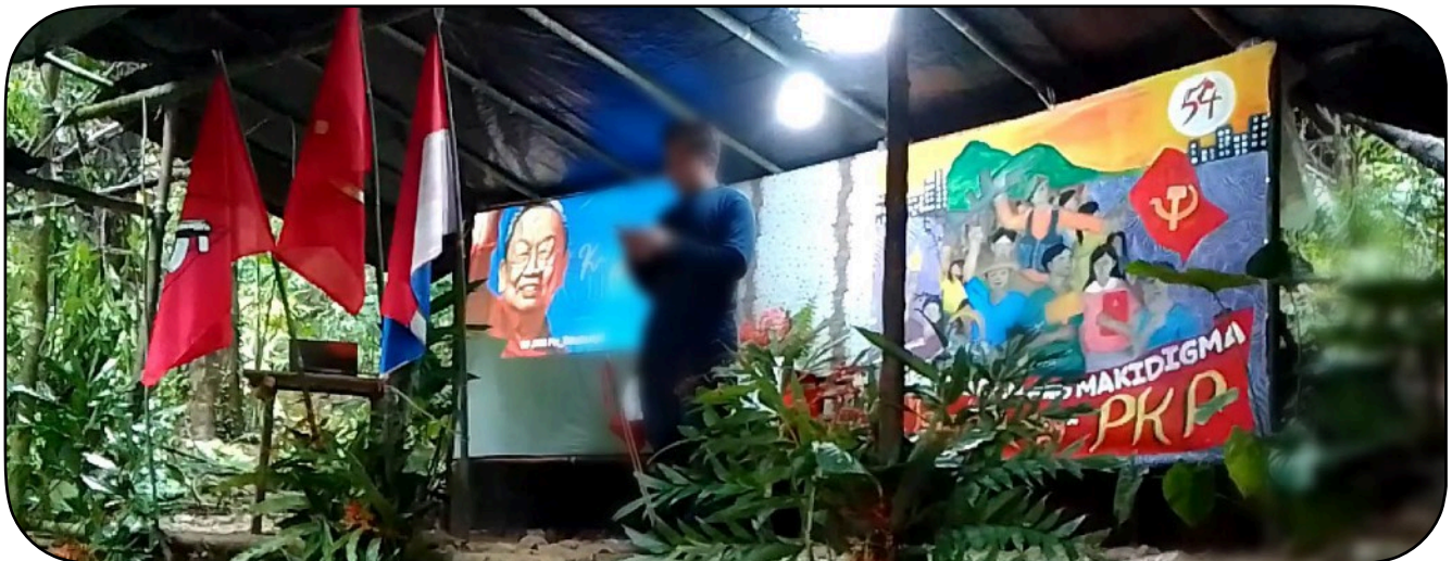
Programa sa mga kauban sa Blcol alang kay Ka Joma

Ang pagbase ni Ka Joma sa Utrecht nahimong sentro sa pulitika sa internasyunal nga komunista ug anti-imperyalistang pagsukol ug kalihukan. Iyang gipatuman ang importanteng papel sa selebrasyon sa sentenaryo ni Mao Zedong niadtong 1993 nga nagsilbing lagsik nga kampanya sa ideolohiya aron subling palig-onon ang Marxista-Leninistang mga panglantaw ug isangyaw ang Maoismo isip ikatulong makasaysayanong paglambo sa Marxismo-Leninismo.