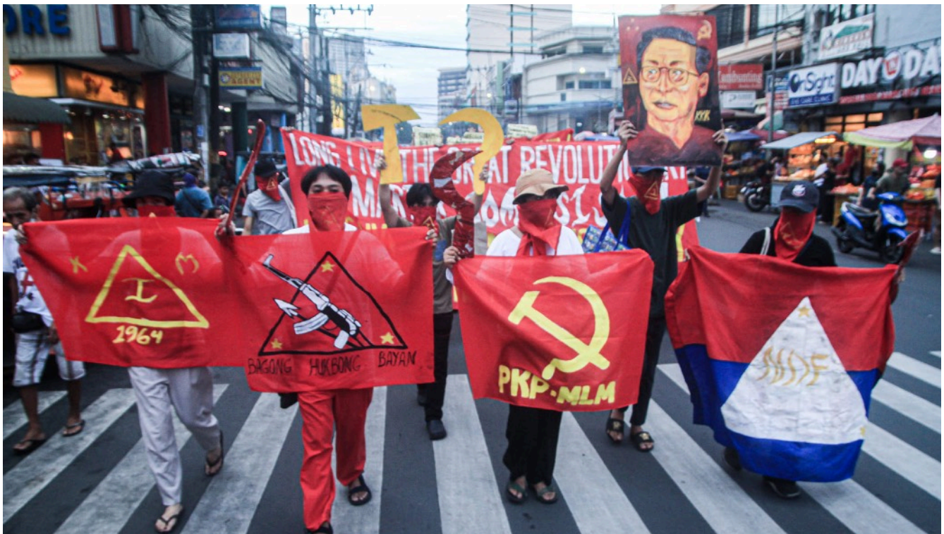
Mga myembro sa Kabataang Makabayan nagpahigayon og lightning rally sa Manila niadtong Disyembre 21, 2022

(Rebolusyonaryong Giya sa Reporma sa Yuta) niadtong Septyembre 1972 nga parehong nagsilbi aron dumalahan ang gimbuhaton sa pagtukod sa mga organisasyong masa, mga organo sa pulitikanhong gahum, mga yunit sa hukbong bayan ug sa Partido, ingonman sa pagpalihok sa mga mag-uuma sa paglunsad og agraryong rebolusyon. Gisulat niya ang Preliminary Report on Northern Luzon (Pasiunang Taho Northern Luzon) kaniadtong Agosto 1970 nga nagsilbing gambalay sa gimbuhaton sa ubang mga komite sa rehiyon.