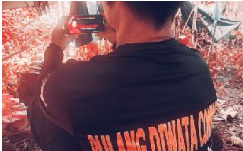
Isa ka Pulang hangaway sa Northeast Mindanao nakabalita sa pagtaliwan ni Ka Joma

Ugaling may nagadaku nga limitasyon sa sarang himuon sang US para gamhan ang Pilipinas, East Asia kag ang bilog nga kalibutan. Ini gihapon ang Numero Uno nga gahum imperyalista pero ara sa estratehikong pagluya ini halin sa pinakamabaskog nga ginlab-ot sini pagkatapos nangin solo nga superpower pagkatapos sang pagbagsak sang Soviet Union sadtong 1991, pagtuwang sa China sa globalisasyon nga “neoliberal”, pagpalapad sang NATO, paglunsar sang mga gerang agresyon sa idalom sang ginatawag nga polisiya nga neokonserbatibo, kag pag-usik sang $10 trilyon nga wala sang naangkon nga pagdaku sang pagahimuslan nga teritoryo.