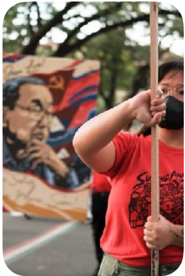
Magmarisa sang mga organisasyong masa sa sulod sang UP-Diliman bilang pasidungog kay Ka Joma, Disyembre 19, 2022

Siyempre, himuon sang reaksyunaryong armadong pwera kag pulis ang tanan nga masarangan nila agud tumuron ang mga prenteng gerilya sang BHB kag itarget sang nakapokus o konsentrado nga mga kampanyang militar. Pero lubos nga nangin bentaha sa BHB ang estratehiya kag taktika sang pagpakig-away gerilya. Kon nagaabante ang superyor nga