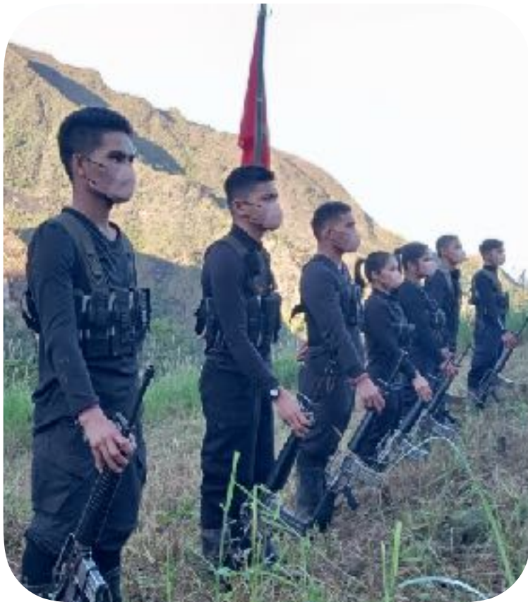
Mga hangaway sang BHB halin sa North Central Mindanao nakapormasyon para sa 21 gun salute nga halad kay Ka Jama

Bilang abanteng destakamento sang proletaryado, dalagku ang naagum sang PKP sa iya hilikuton sa ideolohiya, pulitika kag organisasyon. Ginaubayan ini sang teorya kag praktika sang Marxismo-Leninismo-Maoismo kag ginasapraktika ini sa kasaysayan kag subong nga kahimtangan pangkatilingban sang pumuluyong Pilipino. Ginaabante sini ang pangkabilugang linya sang demokratikong rebolusyon sang banwa nga may