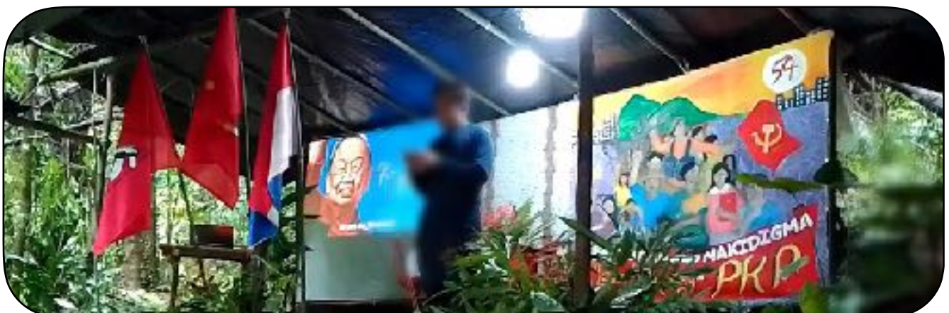
Programa-pasidungog sang mga kaupod sa Bicol para kay Ka Joma

Tubtob sa temprano nga bahin sang 2000, nagtungod siya sang nagapanguna nga papel sa pagtukod sang International Conference of Marxist-Leninist Parties and Organizations (ICMLPO) nga