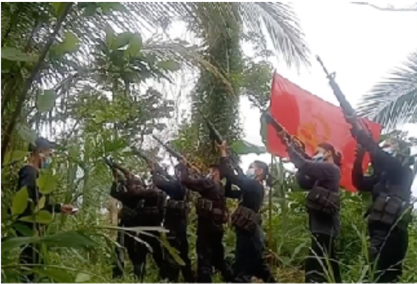
21-gun salute sang mga hangaway sang BHB-Central Luzon para kay Ka Joma

Sa gindalagan sang pinakamalapit nga neoliberal nga pakigbuligay sa China, ginabuyok kag ginapahanugutan sang US kag mga puno nga papet sang Pilipinas ang China nga pagpasilabot sa West Philippine Sea para may rason ang US nga likawan ang pagdumili sa konstitusyon sa mga dumuluong nga base militar kag pwersa sa Pilipinas paagi sang Enhanced Defense Cooperation Agreement para pahanugutan ang mga pwersang militar sang US nga may ara nga eksklusibong mga base kag pasilidad sa sulod sang mga kampo kag reserbasyon militar sang reaksyunaryong armadong pwersa. Pero subong, maathag ang pagpakigbanggi sang US sa China sa pagdambong sa dunang manggad sang Pilipinas kag sang bilog nga ASEAN.