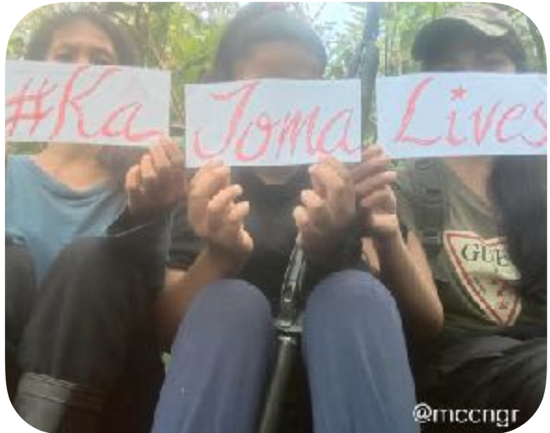
Ginhugyaw sang mga Pulang hangaway sa Negros ang kabuhi ni Ka Joma, Disyembre 19, 2022

Lubos nga kabutigan nga nagagamay kag nagakalutos ang mga rebolusyonaryong pwersa sang banwa kag ang mga Pulang kadre, kumander kag hangaway—lunsay natilawan kag ginpanday sa masobra 54-tuig sang madinalag-on nga inaway banwa—madamuan nga nagakalamatay kag nagakadakup sa mga nakapokus nga operasyon militar o nagasulurender bangud sa mga solusyon nga panghampol pareho sang naputos sa korapsyon nga Enhanced Comprehensive Local Integration Program, Community Support Program kag Barangay Development Program. Pero nagapangayo gihapon nga nagapangayo ang nagaharing guban kag mga suluguon nga militar sang mas daku nga pondo pangpubliko indi lang para atakehon ang pumuluyo