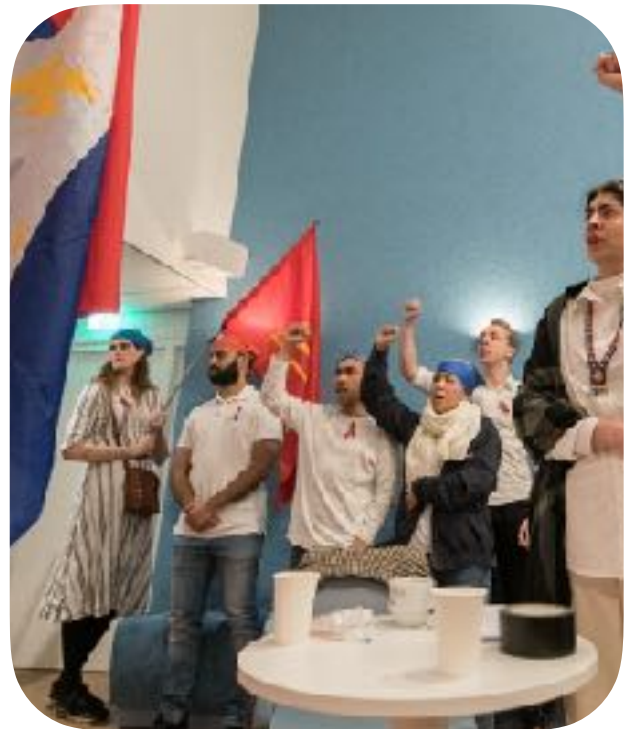
Pasidungog sang mga internasyunal nga abyan sa Utrecht, Disyembre 23, 2022 para Ka Joma

pungsod nga nagaduso sang pungsodnon nga kahilwayan kag nagahandum sang demokrasya kag sosyalismo.