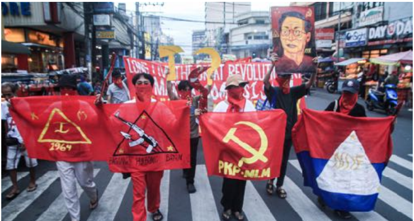
Mga myembro ng Kabataang Makabayan nagraling-iglap noong Disyembre 21, 2022

pareho nagserbi sa pagderiher sa hilikuton sa pagtukod sang mga organisasyong masa, mga organo sang gahum pangpulitika, mga yunit sang hangaway sang banwa kag Partido, subong man sa pagpahulag sa mga mangunguma sa paglunsar sang rebolusyong agraryo. Ginsulat niya ang Pauna nga Pahayag sa North Luzon sang Agosto 1970 nga nagserbi nga ubay sa hilikuton sang iban pang mga komite sa rehiyon.