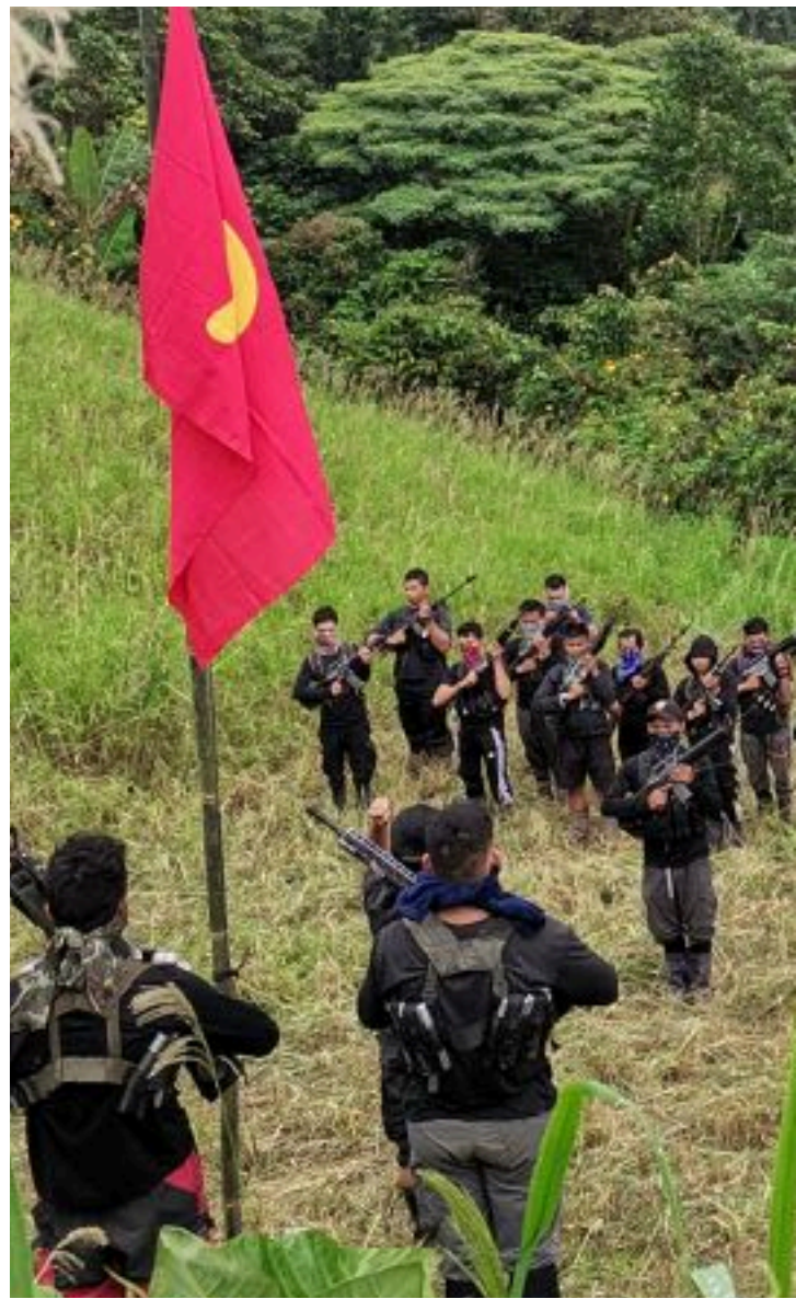
Pagpasidungog sang mga Pulang hangaway kay Ka Joma, Disyembre 19, 2022

Samtang ang nasambit nga tatlo ka pwersang malaut nagahari kag nagaulipon sa pungsod Pilipinas, nagapabilin nga matambok ang duta para magbaskog kag magsulong ang demokratikong rebolusyon sang banwa. Ang permanenteng krisis sang nagaharing sistema nagalala indi lang bangud sa mga paktor sang pagpanghimulos kag pagpamigos sa sulod sang Pilipinas kundi sang pangkalibutanon nga sistemang kapitalista, pangunahon ang monopolyong kapitalismong US. Mapalad ang Pilipinas nga may ara ini nga manggaranon nga dunang resorsa para sa kaugalingon nga pag-uswag, pero sa malain nga palad, permi nagahilisugot ang mga imperyalistang gahum kag ang ila mga reaksyunaryong papet nga himuslan ang barato nga kusog-pangabudlay sang masang anakbalhas nga mga mamumugon kag mangunguma