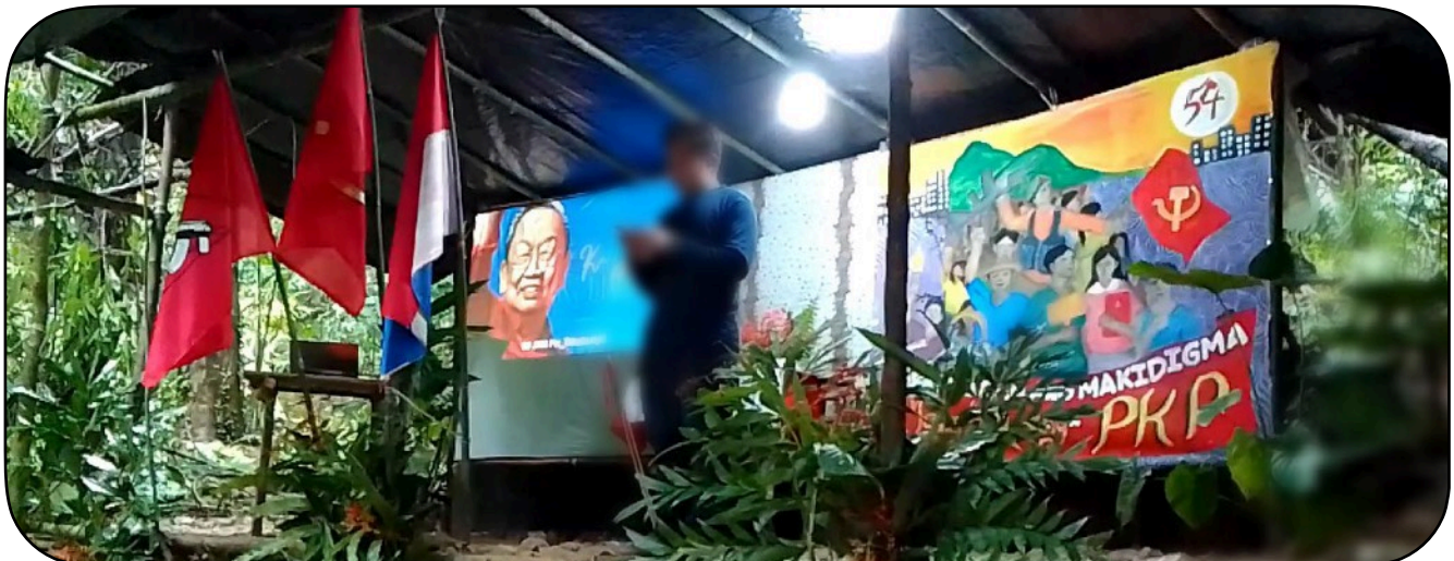
Programang-parangal ng mga kasama sa Bicol para kay Ka Joma

Hanggang sa maagang bahagi ng dekada 2000, gumampan siya ng nangungunang papel sa pagbubuo ng International Conference of Marxist-Leninist Parties and Organizations (ICMLPO) na nagsilbing sentro ng pagtutulungan sa ideolohiya at praktika sa hanay ng mga partidong komunista at manggagawa na nandindigan para sa sosyalismo at tumuligsa sa