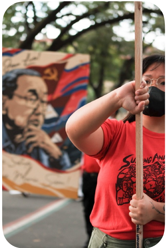
Martsa ng mga organisasyong masa sa loob ng UP-Diliman bilang parangal kay Ka Joma, Disyembre 19, 2022

Kapag ang nakakampong kaaway ay napagod at umatras, BHB naman ang aabante at magdadala ng mas opensibang pagbira. Pero habang mistulang nakalalamang ang kaaway sa pag-abante at pagkampo, ang pwersa ng BHB na taktikal na umatras sa isang larangang gerilya ay maaaring maglunsad ng mga taktikal na opensiba na kaya nitong pagtagumpayan sa mga kalapit na lugar. Pinakamasama para sa kaaway, katulad ng karaniwang nangyayari, sa maraming larangang gerilya sa isang rehiyon at sa lahat ng iba pang rehiyon, pwedeng kunin ng BHB ang inisyatiba sa