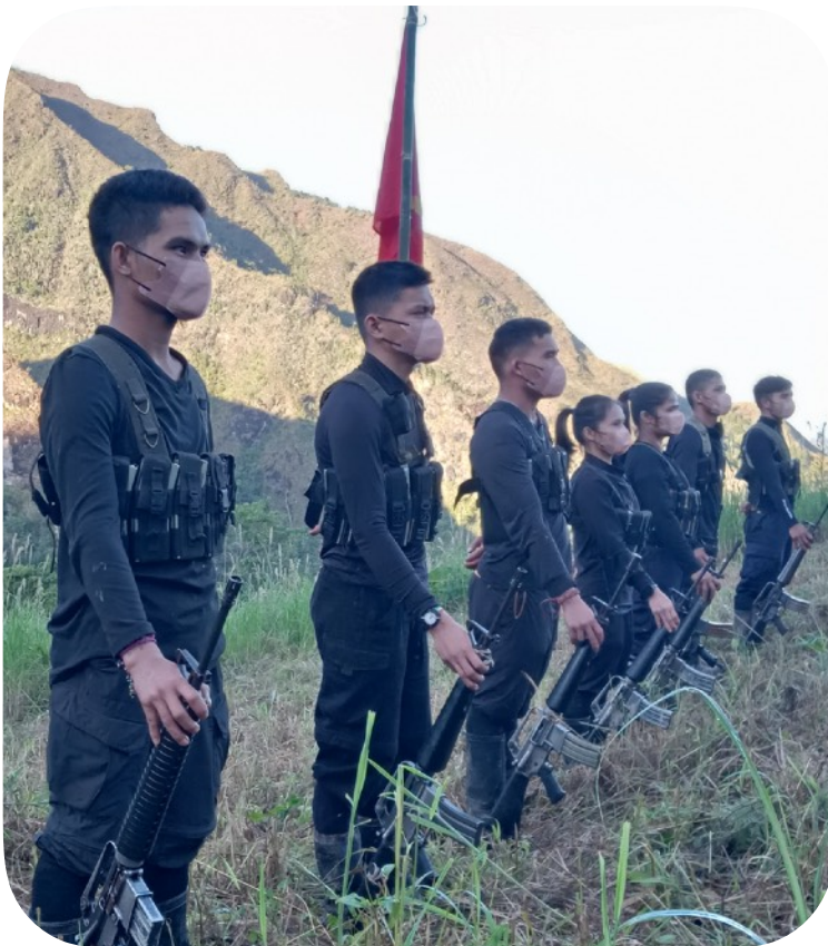
Mga mandirigma ng BHB mula sa North Central Mindanao nakapormasyon para sa 21-gun salute na alay kay Ka Joma

Tungkuling isulong ng BHB ang armadong pakikibaka bilang pangunahing anyo ng paglaban, isakatuparan ang tunay na reporma sa lupa mula sa minimum tungong maksimum na antas at itatag ang rebolusyong baseng masa. May mayor na papel ito sa pagtatayo ng mga organisasyong masa at mga organo ng kapangyarihang pampulitika na bumubuo ng demokratikong gubyernong bayan, at pagsusulong ng mga kampanyang masa para sa edukasyon at organisasyon, reporma sa lupa at kaunlarang sosyoekonomiko, pagtatanggol-sa-sarili, paglutas sa mga sigalot, pangangalaga sa kalikasan at iba pang importanteng tungkulin.