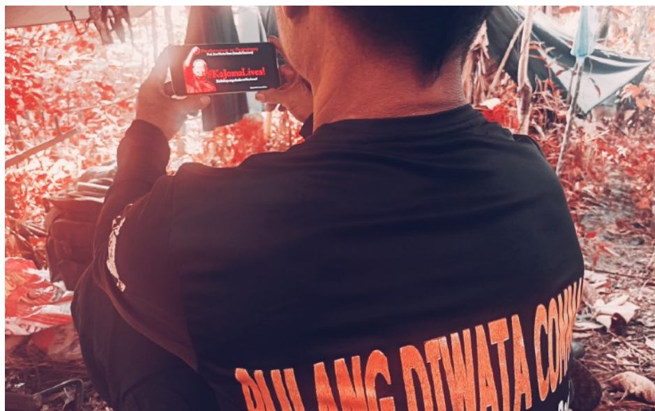
Isang Pulang manggugubat sa Northeast Mindanao nakabalita sa pagpanaw ni Ka Joma

Ang hangganan ng kapangyarihan ng imperyalismong US ay nalantad ng kabiguan nitong saklutin ang yamang langis at magtayo ng 16 na base militar sa Iraq, wasakin ang alyansang Syria-Russia-Iran, wasakin ang rebolusyonaryong pakikibaka ng mamamayang Turkish at Kurdish at hawakan ang Afghanistan na isinurender nito sa Taliban. Sa kasalukuyang sigalot sa pagitan ng Russia at Ukraine, ginagamit ng US ang Ukraine bilang proxy para bantaan at udyukin ang Russia na maglunsad ng gera subalit ang sigalot ay humantong lang sa paglulustay ng rekurso kapwa ng imperyalismong Russia at US. Itinulak din nito ang mga alyado ng US sa NATO na maghinaing kung bakit dapat silang gumastos ng mas malaki para sa suplay sa enerhiya mula sa US kaysa murang langis mula sa Russia.