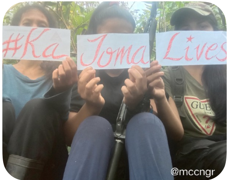
Ipinagbunyi ng mga Pulang mandirigma sa Negros ang buhay ni Ka Joma, Disyembre 19, 2022

Ang totoo, upisyal na inamin ng reaksyunaryong