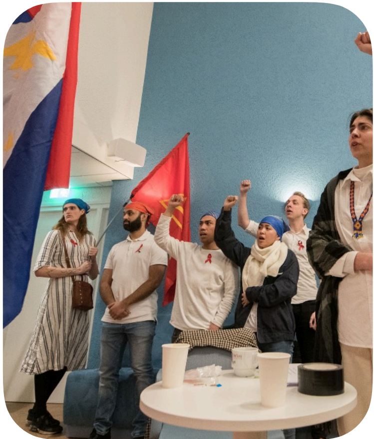
Parangal ng internasyunal na mga kaibigan sa Utrecht, Disyembre 23, 2022 para Ka Joma

Ang masang anakpawis at buong sambayanan na nakikibaka para sa pambansang kalayaan, demokrasya at