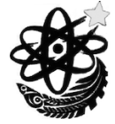
Liga ng Agham Para sa Bayan