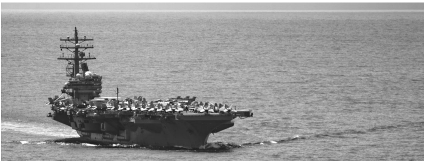
USS Ronald Reagan (CVN-76) samtang nagabyahe sa balabac Strait kag padulong sa South China Sea sadtong Hulyo 12, 2022