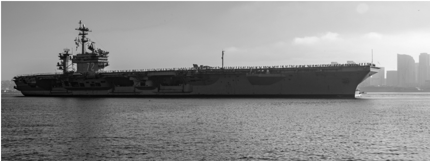
USS Abraham Lincoln (CVN 72), nagapamuno nga barko sang Abraham Lincoln Carrier Strike Group, sadtong Agosto 11, 2022 pagkatapos ang pagplatar sini sa Indo-Pacific