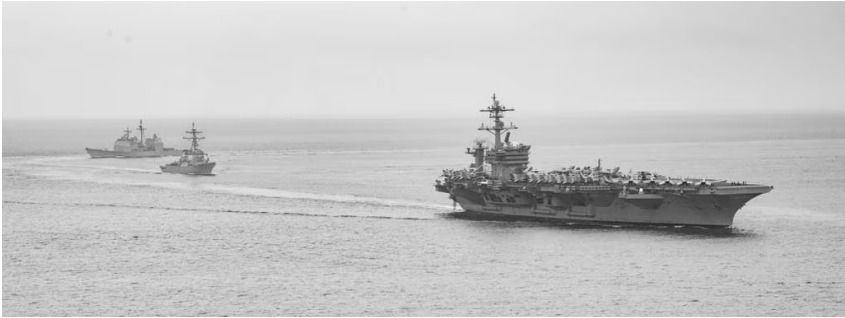
Carl Vinson aircraft carrier nga yara sa Pacific sadtong Hulyo 2021

Nagalutaw nga mga base militar sang US sa Asia nga may sakay nga 7,000 tinawo kag 90 ka salakyan pangkahawaan: