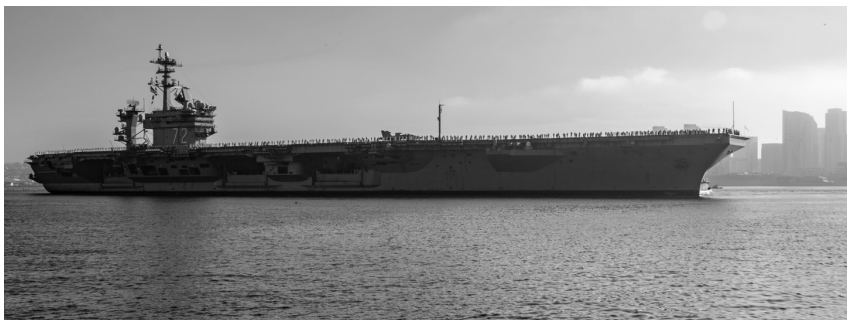
USS Abraham Lincoln (CVN 72), mangidadaulo a bapor ti Abraham Lincoln Carrier Strike Group, idi Agosto 11, 2022 kalpasan ti panagpakat na idia Indo-Pacific (US Navy)