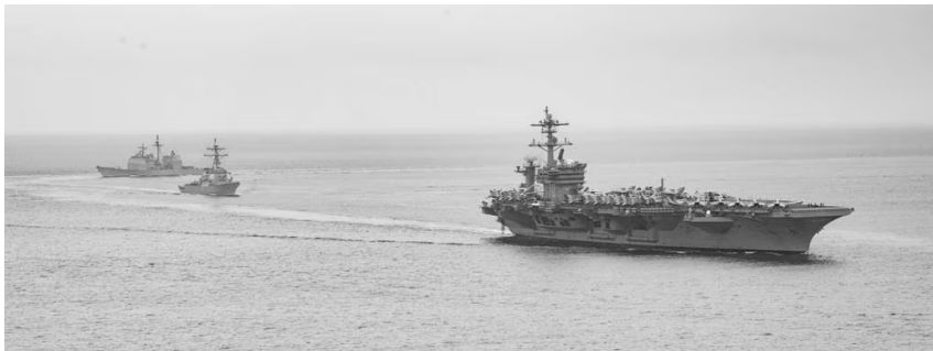
Carl Vinson aircraft carrier nga adda idia Pacific idi Hulyo 2021

Dagiti agtatapaw a base militar ti US iti Asia nga adda nakalugan a 7,000 tao-an ken 90 lugan pangtangatang: