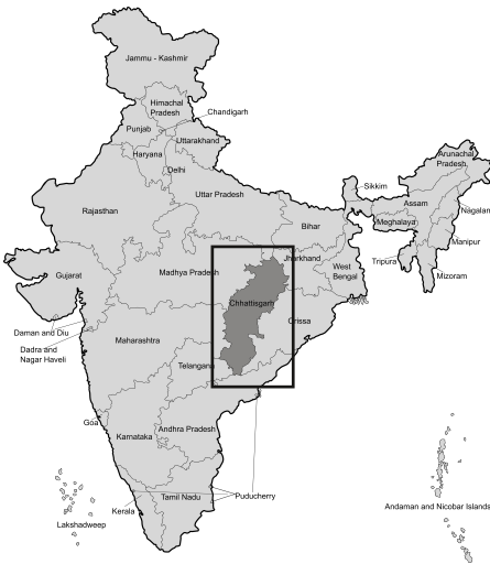
Mapa ng India