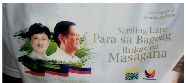
Larawan ng t-shirt na ipinamigay ng DAR