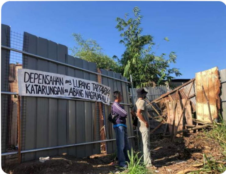
Larawan ng dinemolis na bahagi ng barikada ng mga magsasaka sa Lupang Tartaria, Silang, Cavite

ang mga maton na gawin iyon dahil walang permit mula sa munisipyo ang Jarton Security.