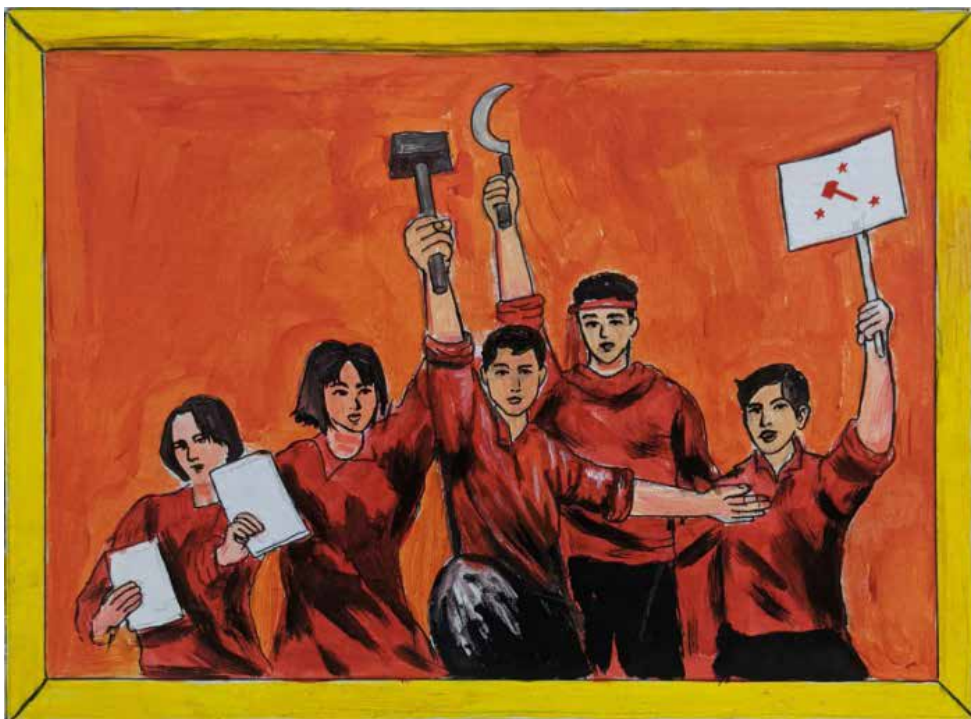
Dibuho ni K. Panalig

Hindi mahigpit na naisasabuhay ang gawaing masa maging ang pagkukumbina ng ligal at ilegal, hayag at di hayag na pagkilos. Marami sa mga kadre’t organisador ang de-opisina, de-lastiko at sandal sa elektronikong komunikasyon ang manera. Hindi