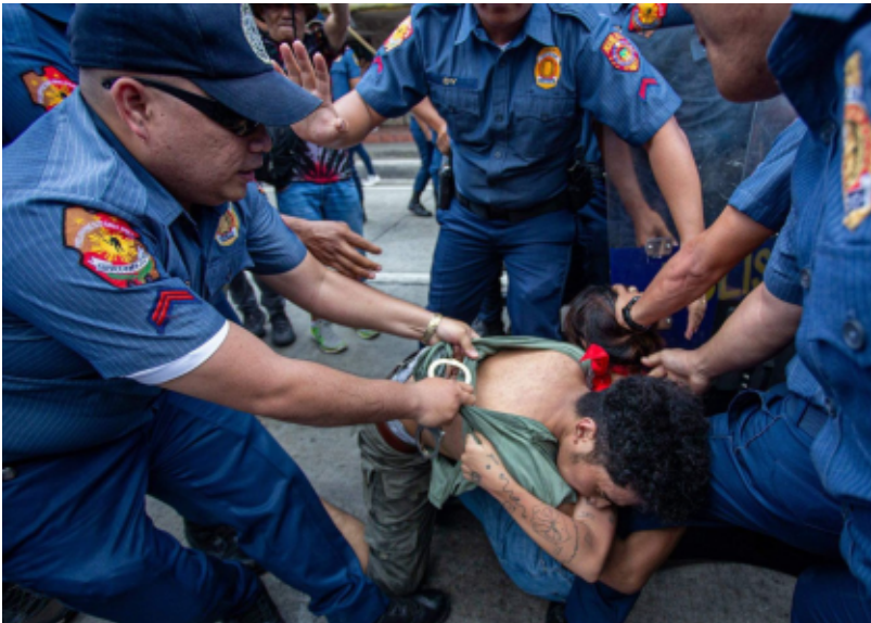
Pag-aresto na mga pulis sa isang raliyista na kabilang sa Mayo Uno 6.

Mayo Uno 6. Anum ka pamatan-on nga aktibista ang mapintas nga gin-aresto sang mga pulis sadtong Mayo 1 samtang nagapatigayon sang protesta sa embahada sang US. Ginbansagan nga Mayo Uno 6, nagdugay sa prisohan ang anum tungod sa hungod nga pagpadugay sang korte sa pagproseso sang ila pyansa kag kaso. Nahilway sila isa ka semana pagkatapos nga gin-aresto.