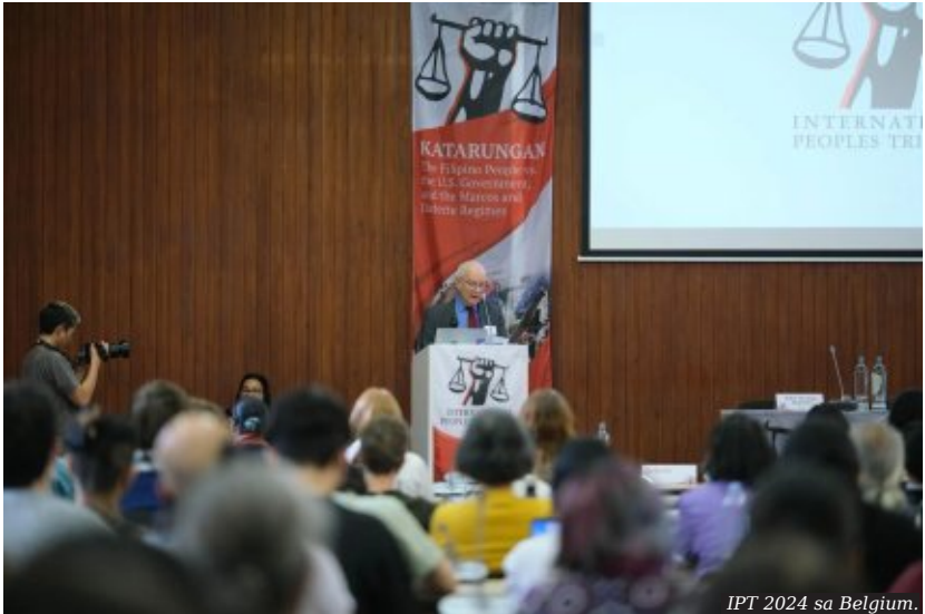
IPT 2024 sa Belgium.

Magpaguwa ang tribunal sang bug-os nga desisyon nga nagaunod sang mga detalyado nga natukiban kag padayon nga sundan ang sitwasyon sa Pilipinas. Ang mga kopya sang pamatbat ipadala sa mga akusado kag ibalhang para sa lain-lain nga internasyunal nga mga institusyon kag interesado nga partido.