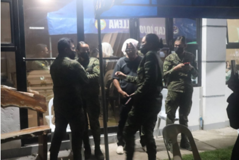
Humanitarian Mission ng Karapatan-Southern Tagalog sa Tuy, Batangas.

nadala pauli sang pamilya sang isa pa ka martir ang iya bangkay. Sa pila ka kaangay nga higayon, ginunggan sang mga pulis ang imbestigasyon kag pag-autopsy sa mga bangkay sang namartir. Indi man pila ka higayon nga pati ang mga lalaw kag lubong ginagamo sang mga soldado.