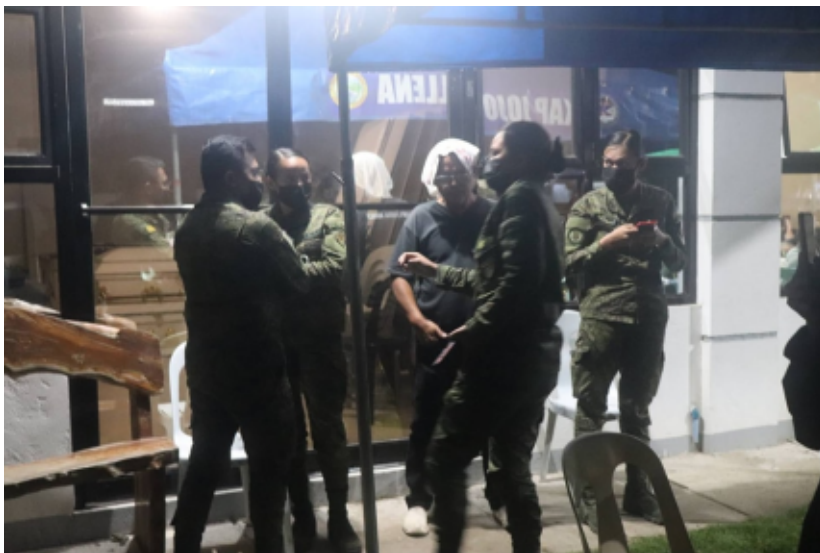
Humanitarian Mission ng Karapatan-Southern Tagalog sa Tuy, Batangas.

Sa ilang katulad na pagkakataon, pinipigilan ng mga pulis ang imbestigasyon at pag- autopsy sa mga bangkay ng namartir. Hindi rin iilan ang pagkakataong pati ang burol at libing ay ginugulo ng mga sundalo.