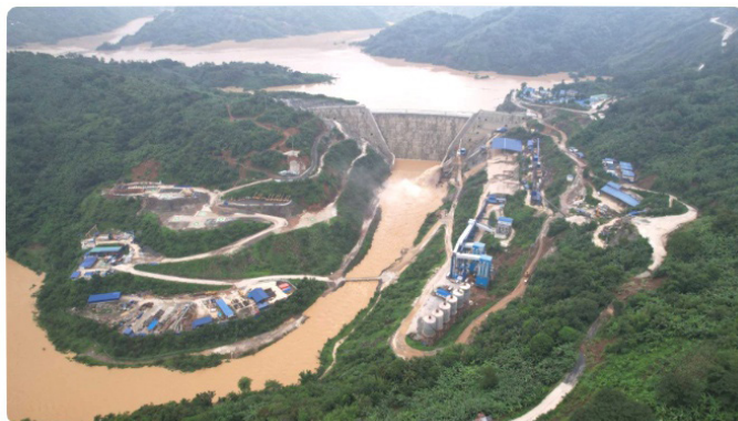
Litrato ng pagpasok ng baha sa Upper Wawa Dam Reservoir sa kasagsagan ng bagyong Carina Rodriguez, Rizal

Sa tindi ng pinsala, kinwestyon ang integridad ng higit P244-bilyong halagang mga proyekto ng rehimeng US-Marcos II na umano'y para sa "pagkontrol ng baha", na nauna niyang ipinagmayabang sa kanyang ikatlong SONA.