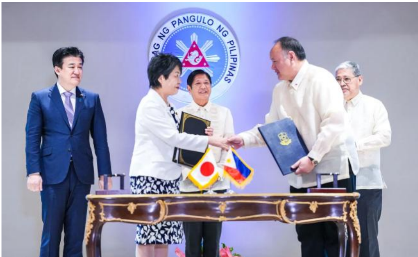
Pinirmahan ng Pilipinas at Japan ang Reciprocal Access Agreement sa Malacañang noong Hulyo 8, 2024.

Sa pamamagitan ng RAA, bibigyang daan ng rehimeng Marcos ang Japan ang pagpapalakas ng panghihimasok nito sa Pilipinas kapalit ng pagbibigay ng mga kagamitang militar, gayundin ang mga pangako ng pamumuhunan at pautang para sa mga neoliberal na programa at patakaran. Higit din nitong itinatali ang bansa sa imperyalistang alyansang mapandigma na pinamumunuan ng US. Higit itong babagbag sa kakayahan ng bansa na independyenteng igiit ang sarili nitong mga interes at adhikain.