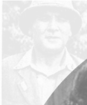
Major General Franke, commander of the 11th Airborne Division, who led the Japanese forces in the capture of Cebu.