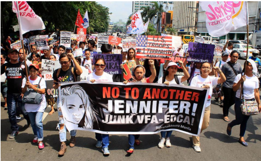
Mga progresibong grupo nagmartsa padulong sa Embahada sa US sa Maynila alang sa ika-3 nga anibersaryo ng pagpatay kang Jennifer Laude niadtong Oktubre 11, 2018.

Ang maong mga probisyon pareho kaayo sa mga probisyon sa US-RP Visiting Forces Agreement nga gigamit aron makalusot ang pipila ka tropang Amerikano nga nakahimo og krimen sa Pilipinas, pananglitan si US Marine Lance Cpl. Joseph Scott Pemberton nga mipatay sa transgender nga si Jennifer Laude niadtong 2014 ug Marine Lance Cpl. Daniel Smith nga milugos sa Pilipinang si “Nicole” niadtong 2006. Sama sa VFA ug uban pang dili patas nga kasabutang militar sa Pilipinas ug US, pagadamayon sa RAA ang nasud sa mga gubat sa Japan tungod sa presensya sa mga tropa ug gamit militar niini sa nasud.