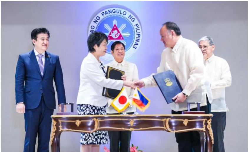
Gipirmahan sa Pilipinas ug Japan ang Reciprocal Access Agreement sa Malacañang niadtong Hulyo 8, 2024.

Pinaagi sa RAA, pagahatagag dalan sa rehimeng Marcos ang pagpakusog sa interbensyon sa Japan sa Pilipinas bugti sa paghatag og mga himang militar, ingonman ang mga saad sa pamuhunan ug pautang alang sa mga neoliberal nga programa ug palisiya. Labaw usab niining ginahikot ang nasud sa imperyalistang alyansa sa gubat nga gipangulohan sa US. Labaw kining magpahuyang sa kapasidad sa nasud nga independyenteng iduso ang kaugalingon niining mga interes ug pangandoy.