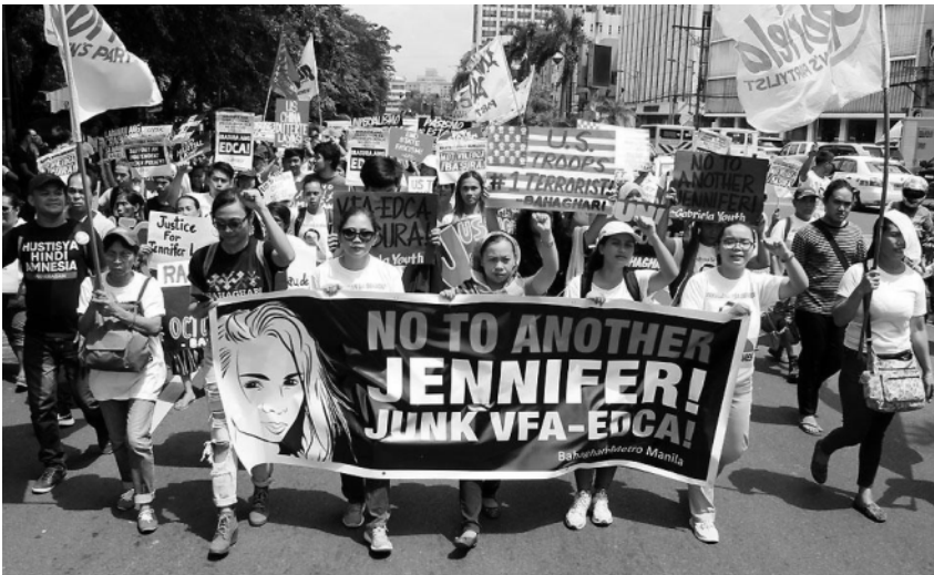
Mga progresibong grupo nagmartsa padulong sa Embahada sa US sa Maynila alang sa ika-3 nga anibersaryo ng pagpatay kang Jennifer Laude niadtong Oktubre 11, 2018.

Ang maong mga probisyon pareho kaayo sa mga probisyon sa US-RP Visiting Forces Agreement nga gigamit aron makalusot ang pipila ka tropang Amerikano nga nakahimo og krimen sa Pilipinas, pananglitan si US Marine Lance Cpl. Joseph Scott Pemberton nga mipatay sa transgender nga si Jennifer Laude niadtong 2014 ug Marine Lance Cpl. Daniel Smith nga milugos sa Pilipinang si “Nicole” niadtong 2006. Sama sa VFA ug uban pang dili patas nga kasabutang militar sa Pilipinas ug US, pagadamayon sa RAA ang nasud sa mga gubat sa Japan tungod sa presensya sa mga tropa ug gamit militar niini sa nasud.