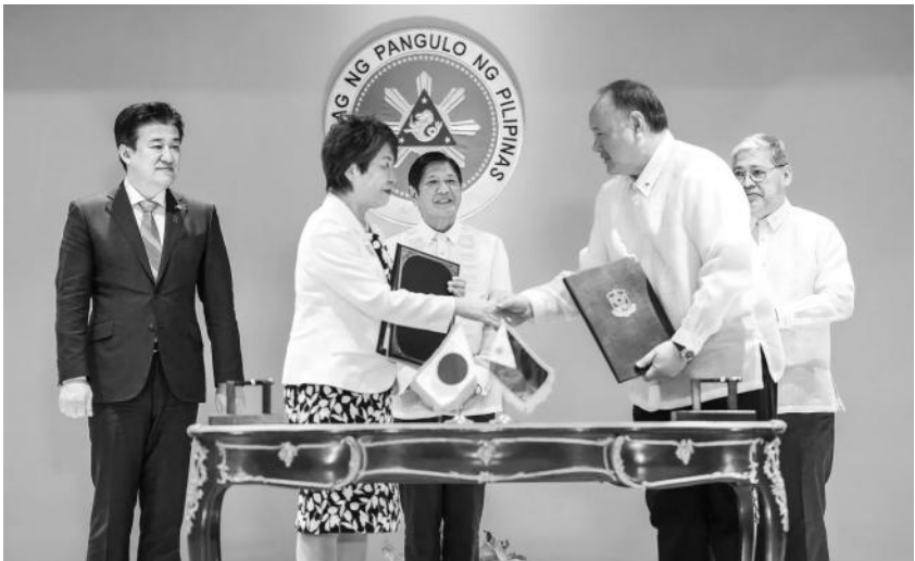
Gipirmahan sa Pilipinas ug Japan ang Reciprocal Access Agreement sa Malacañang niadtong Hulyo 8, 2024.

Pinaagi sa RAA, pagahatagag dalan sa rehimeng Marcos ang pagpakusog sa interbensyon sa Japan sa Pilipinas bugti sa paghatag og mga himang militar, ingonman ang mga saad sa pamuhunan ug pautang alang sa mga neoliberal nga programa ug palisiya. Labaw usab niining ginahikot ang nasud sa imperyalistang alyansa sa gubat nga gipangulohan sa US. Labaw kining magpahuyang sa kapasidad sa nasud nga independyenteng iduso ang kaugalingon niining mga interes ug pangandoy.