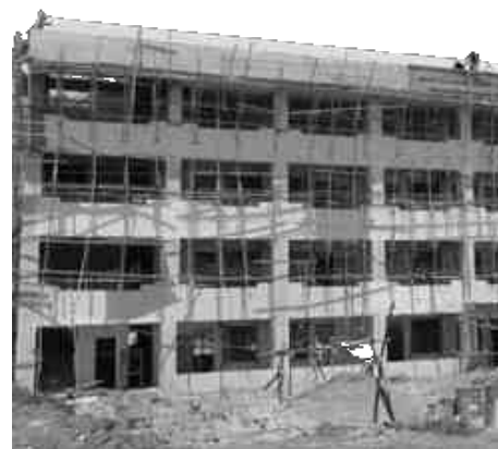
Gikan sa: 2022 Census of Agriculture and Fisheries

pinakadaghan human gibalaod ang liberalisasyon sa importasyon sa bugas nga nagresulta sa pagkahagba sa produksyon sa humay ug mais.