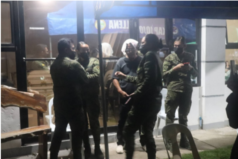
Humanitarian Mission ti Karaptan-Southern Tagalog idiay Tuy, Batangas.

Iti kapada a panawen laplappedan dagiti pulis ti pannakaimbestiga ken otopsia ti bangkay dagiti nagmartir. Saan met a sumagmamano dagiti gundaway nga uray ti lamay ken punpon ket buriboren dagiti soldado.