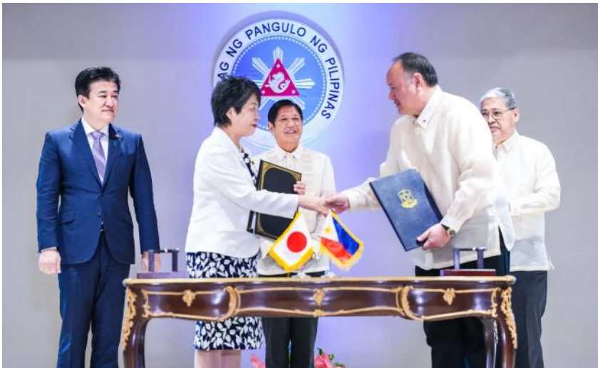
Pinirmaan ti Pilipinas ken Japan ti Reciprocal Access Agreement idiay Malacañang idi Hulyo 8, 2024.

Babaen ti RAA, wayaan ti rehimen Marcos ti panangpapiaksa ti pannaki-biang ti Japan iti Pilipinas kasukat ti panangted kadagiti ramit militar, kasta met dagiti kari ti panagpuonan ken pautang para kadagiti neoliberal a programa ken patakaran. Ad-adda met nga igalgalut daytoy ti pagilyan iti imperyalista nga alyansa a managgubat nga idadauluan ti US. Ad-adda pay a rebbaen daytoy ti kabaalan ti pagilyan nga ipaganetget ti bukod na nga interes ken tarigagay.