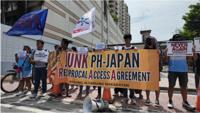
Inyuna ti Bagong Alyansang Makabayan (Bayan) ti protesta iti embahada ti Japan idiay Pasay City idi July 8 laban iti PH-Japan Reciprocal Access Agreement.