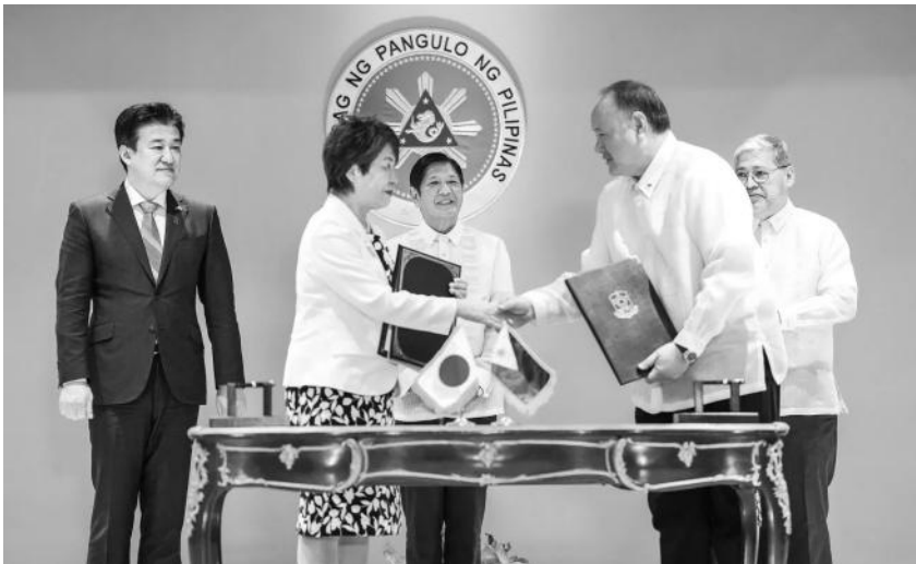
Pinirmaan ti Pilipinas ken Japan ti Reciprocal Access Agreement idiay Malacañang idi Hulyo 8, 2024.

Babaen ti RAA, wayaan ti rehimen Marcos ti panangpapi-gisa ti pannaki-biang ti Japan iti Pilipinas kasukat ti panangted kadagiti ramit militar, kasta met dagiti kari ti panagpuonan ken pautang para kadagiti neoliberal a programa ken patakaran. Ad-adda met nga igalgalut daytoy ti pagilyan iti imperyalista nga alyansa a managgubat nga idadauluan ti US. Ad-adda pay a rebbaen daytoy ti kabaellan ti pagilyan nga ipaganetget ti bukod na nga interes ken tarigagay.