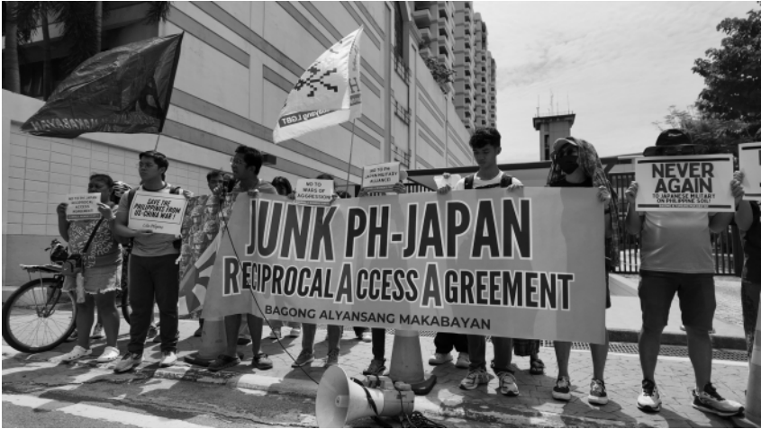
Inyuna ti Bagong Alyansang Makabayan (Bayan) ti protesta iti embahada ti Japan idiay Pasay City idi July 8 laban iti PH-Japan Reciprocal Access Agreement.