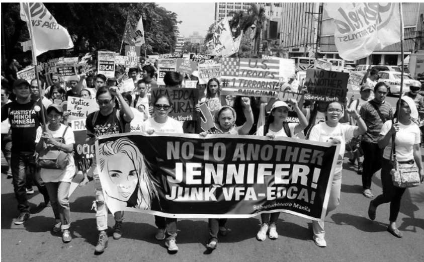
Dagiti progresibo a grupo a nagmartsa agturong iti Embahada ti US iti Manila para iti maika-3 anibersaryo ti pampapatay ken Jennifer Laude idi Oktubre 11, 2018.

Dagiti nadakamat a probisyon ket kapada dagiti probisyon ti US-RP Visiting Forces Agreement a naaramat tapno makalusot ti sumagmamano a tropa nga Amerikano a nakaaramid ti krimen iti Pilipinas, kas ken US Marine Lance Cpl. Joseph Scott Pemberton a pimmatay iti transgender a ni Jennifer Laude idi 2014 ken Marine Lance Cpl. Daniel Smith a nangrames iti Pilipina a ni "Nicole" idi 2006. Kas ti VFA ken dadduma pay a katulagan militar ti Pilipinas ken US, iguyod ti RAA ti pagilyan kadagiti susik ti Japan gapu iti presensya dagiti tropa ken ramit militar na iti pagilyan.