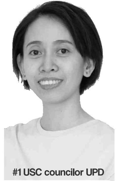
#1 USC councilor UPD

pinakasyahan nga priso pulitikal nga nagdaug komo konsehal ha eleksyon para ha UP-Diliman University Student Council. Nakakuha hiya hin 4,830 nga boto nga naeleher komo numero uno nga konsehal. Haros 5 katuig na hiya nga nakapriso ha Tuguegarao City ha hinimu-himo nga kaso.