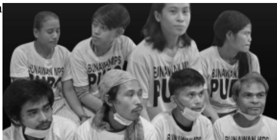
Palayain ang Agusan 8!

Giit nila, wala sang rason ang mga pwera sang estado agud patigayunon ang pagda-