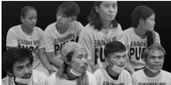
Wayawayaan ti Agusan 8!

Inpetteng da nga awan ti gapu na a kinemmeg isuda dagiti pwersa ti estado. Inpaganetget dagiti biktima a pinarbo dagiti kaso ken parparwaren da nga adda ti naala kadakwada