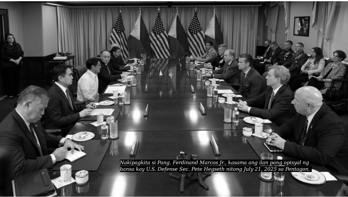
Nakipagkita si Pang. Ferdinand Marcos Jr., kasama ang ilan pang opisyal ng bansa kay U.S. Defense Sec. Pete Hegseth nitong July 21, 2025 sa Pentagon.

“Nasa hyperdrive ” din na mailalarawan ang pagkakandarapa ni Marcos at ng Armed Forces of the Philippines (AFP) na tuparin ang mga dikta ng US at gampanan ang itinakdang papel ng tutang gubyrerno nito alinsunod sa nabanggit na estratehikong plano. Kapitalit ng pagpapakatutang ito ang ibinibigay na suportang pampulitika at pangmilitar ng US kay Marcos. Sa pagitan ng 2022 at 2024, tumanggap si Marcos ng $1.14 bilyon (P64.98 bilyon) sa ilalim ng programang Foreign Military Financing ng US, liban