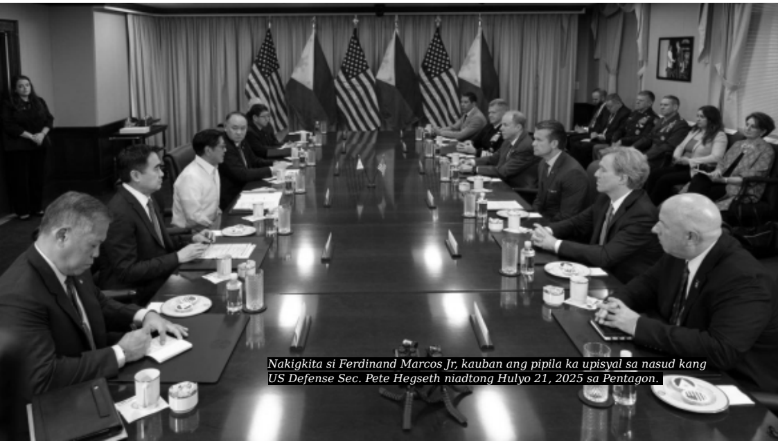
Nakigkita si Ferdinand Marcos Jr, kauban ang pipila ka upisyal sa nasud kang US Defense Sec. Pete Hegseth niadtong Hulyo 21, 2025 sa Pentagon.

“Anaa sa hyperdrive ” usab kung ihulagway ang pagdalidali ni Marcos ug sa Armed Forces of the Philippines (AFP) nga tumanon ang mga dikta sa US ug buhaton ang gitakdang papel sa tutang gubyerno niini subay sa nahisgutang estratehikong plano. Bugti sa pagpakaitoy ang suportang sa pulitika ug militar sa US kang Marcos. Sa tunga-tunga sa 2022 ug 2024, midawat si Marcos og $1.14 bilyon (P64.98 bilyon) ilalum sa programang Foreign Military Financing sa US, gawas pa sa