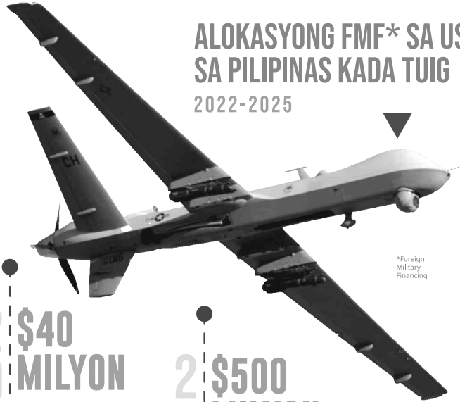
*Foreign Military Financing

Kapin doble sa istandard nga alokasyong $40 milyon; nakagahin para sa modernisasyon sa AFP (posibleng pagpalit sa mga Boeing CH-47 Chinook helicopters ug armored vehicles )